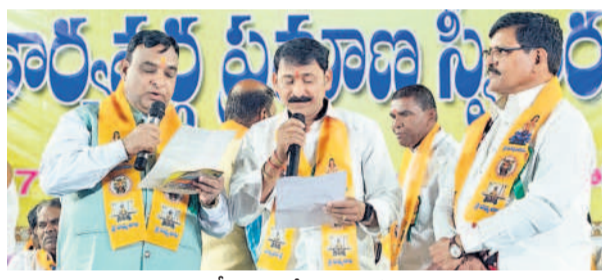
రాష్ట్ర పద్మశాలి సంఘం అసోసియేట్ అధ్యక్షుడిగా హరి