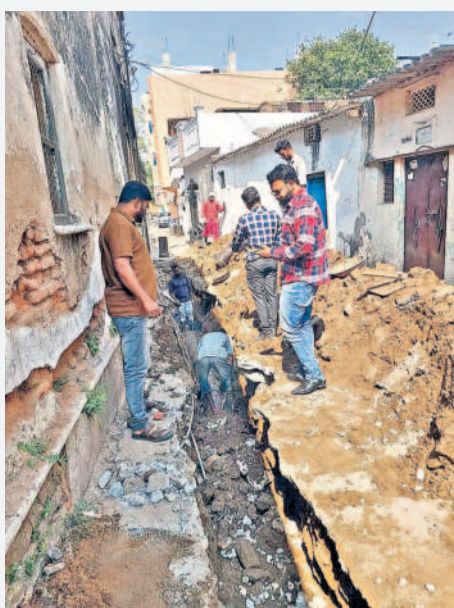
పాజిహాస్ కాలనీలో సీవర్ జీ లైన్