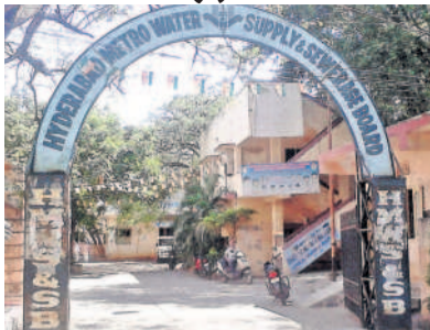
డీడి కాలనీలోని అడిక్ మెట్ సెక్షన్ కార్యాలయం

బాగంబర్ పేట్ డివిజన్ పరిధిలో వచ్చే వారు రివర్స్ అడిక్ మెట్ సెక్షన్ పరిధిలో డ్రైనేజీ సమస్యకు సంబంధించి ఫిర్యాదులు ఎక్కువగా ఉంటాయి. ఆన్ లైన్ కాకుండానే బస్టోల్ ఉంటే వెళ్తారు. వివిధ ప్రాంతాల నాయకులు, ప్రజాప్రతినిధుల దృష్టికి వచ్చే డ్రైనేజీ సమస్యలు కూడా ఉంటాయి. వీటిని పరిష్కరించేందుకు ప్రస్తుతం ఇద్దరు కార్పొరేట్లు మాత్రమే ఉన్నాయి. ఫిర్యాదులు మాత్రమే ఉన్నాయి. ఫిర్యాదులు మాత్రం ఎందరకు వస్తున్నాయి. వాటిని ఇద్దరు కార్పొరేట్లు పరిష్కరించలేకపోతున్నారు. అధికారులు స్పందించి వెంటనే కార్పొరేట్లను నియమిస్తే డ్రైనేజీ సమస్యలు పరిష్కరించుకోవచ్చు.