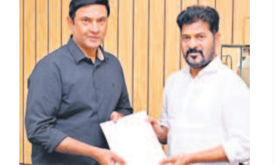
సీఎం రేవంత్ రెడ్డికి వినతిపత్రం ఇస్తున్న ఎమ్మెల్యే మర్రి రాజశేఖర్ రెడ్డి

మల్కాజిగిరి: భూముల రిజిస్ట్రేషన్లను నిలిపివేయడం ప్రభుత్వ వైఫల్యమని ఎమ్మెల్యే మర్రి రాజశేఖర్ రెడ్డి అన్నారు. బుధవారం అసెంబ్లీ కార్యాలయంలో సీఎం రేవంత్ రెడ్డిని కలిసి వినతిపత్రం అందజేశారు. ఈ సందర్భంగా ఎమ్మెల్యే మర్రి రాజశేఖర్ రెడ్డి మాట్లాడుతూ మల్కాజిగిరి సర్కిల్ పరిధిలోని 382 ఎకరాలను, 100 సర్వే సంఖ్య, 70 కాలనీలోని భూముల లావాదేవీలను వక్క బోర్డు సీకమ్ బేజీలను రిజిస్ట్రేషన్లను నిలిపివేస్తూ ఇచ్చిన ఉత్తర్వులను వల్ల ప్రజలు ఇబ్బందులు పడుతున్నారన్నారు. దాదాపు 30 ఏండ్ల కిందట ఇక్కడ ఇండ్లు కట్టుకొని పేదలు నివసిస్తున్నారన్నారు. దాదాపు 1,967 కుటుంబాల్లో లక్ష మంది నివసిస్తున్నారని పేర్కొన్నారు. ఇండ్ల కొనుగోలు, అమ్మకాలు నిషేధించడంతో ప్రజలు ఇబ్బందులు పడుతున్నారని పేర్కొన్నారు. వక్క బోర్డు నిషేధించిన జాబితా