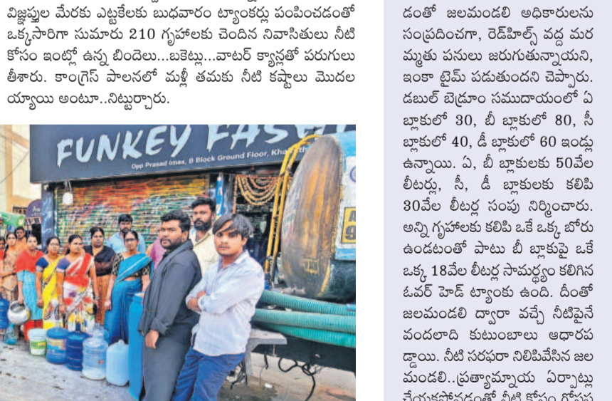
నీటి కోసం ట్యాంకర్ వద్ద బాబులు తీరన డబుల్ బెడ్రూం గృహాల నివాసాలు

ఖైరతాబాద్, డిసెంబర్ 18 : మళ్ళీ మునుపటి రోజులు గుర్తుకు వస్తున్నట్లు కనిపిస్తోంది. ఖైరతాబాద్ ఇందిరానగర్లోని డబుల్ గ్యూజెట్ సముదాయంలో తాగునీటి కలకు బద్దడింది. ఐదు రోజులుగా జలపండ్ల నుంచి నీటి సరఫరా నిలిచిపోయింది. అధికారులు ప్రత్యామ్నాయ ఏర్పాటు చేయకపోవడంతో రోజు అవసరాలు, తాగునీటి నివాసాలు ఇబ్బందులు పడుతున్నాయి. రోజుల తరబడి విజ్ఞాపనల మేరకు ఎట్టకేలకు బుధవారం చెందిన సమస్యతో ఒక్కసారిగా సుమారు 210 గృహాలకు చెందిన నివాసాలు నీటి కోసం ఇంట్లో ఉన్న బిందెలు..బెట్టు..వాటర్ క్యాన్లతో పరుగులు తీశారు. కాంగ్రెస్ పాలనలో మళ్ళీ తమకు నీటి కష్టాలు మొదలుయ్యాయి అంటూ..నిట్టూర్చారు.