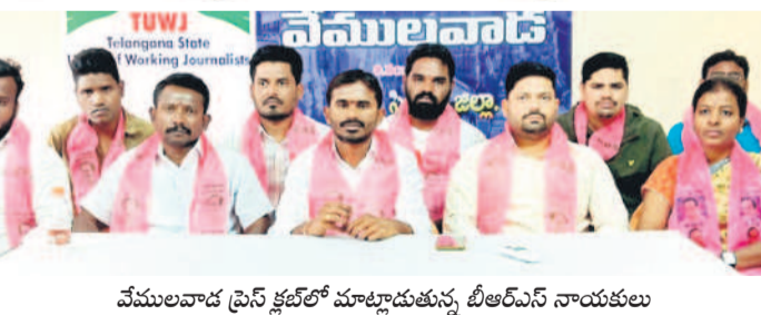
వేములవాడ ప్రెస్ క్లబ్ లో మాట్లాడుతున్న బీఆర్ఎస్ నాయకులు