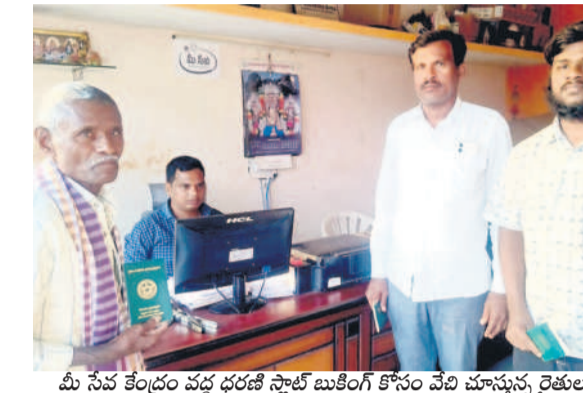
మీ సేవ కేంద్రం వద్ద ధరణి పోర్ట్ బస్ కింగ్ కోసం వేచి చూస్తున్న రైతులు

పెగడపల్లి, డిసెంబర్ 18: ధరణి పోర్ట్ మళ్ళీ రాష్ట్ర వ్యాప్తంగా నిలిచింది. బుధవారం భూముల రిజిస్ట్రేషన్, స్లాట్ బస్ కింగ్ ల రైతులు తీవ్ర ఇబ్బందులు పడుతున్నారు. ధరణి పోర్ట్ సవరణలో భాగంగా డిసెంబర్ 12 నుంచి సాయంత్రం 5 గంటల నుంచి 18 వేదీ ఉదయం వరకు డాటా టేన్ ఆన్ లైన్ ప్రక్రియను చేపట్టింది. తిరిగి ఈ నెల 18 నుంచి ధరణి సేవలు యథావిధిగా ప్రారంభం కాగా, ఈ నెల 16న ధరణి పోర్ట్ లో రిజిస్ట్రేషన్ కోసం రాష్ట్ర వ్యాప్తంగా 1785 మంది రైతులు స్లాట్ బస్ కింగ్ చేసుకున్నారు. అందులో 1402 మంది భూములను రిజిస్ట్రేషన్ చేసుకున్నారు. అలాగే 17న మంగళవారం 1917 మంది ధరణి పోర్ట్ లో భూముల రిజిస్ట్రేషన్ కోసం స్లాట్ బస్ కింగ్ చేసుకోగా, బుధవారం కేవలం 1141 మంది భూముల రిజిస్ట్రేషన్ చేసుకున్నారు. బుధవారం మధ్యాహ్నం 2 గంటల నుంచే ధరణి పోర్ట్ పని చేయక పోవడంతో రాష్ట్ర వ్యాప్తంగా అనేక వ్యవసాయ భూముల రిజిస్ట్రేషన్ నిలిచిపోయాయి. దీంతో రైతులు తీవ్ర ఇబ్బందులు ఇబ్బంది పడ్డారు. దీనికి తోడు ధరణిలో భూముల రిజిస్ట్రేషన్ కోసం స్లాట్ బస్ కింగ్ రైతులు మీ సేవ కేంద్రాలు, డాక్యుమెంట్ రైటర్ దగ్గరికి వెళ్ళగా.. ధరణి సైట్ పని చేయడం లేదని నిర్వాహకులు చెబుతుండడంతో చేసేదేం లేక నిరాశతో వెనుదిరిగారు.