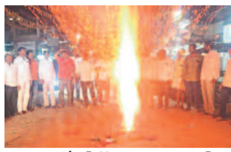
పట్టణ సరందరెడ్డికి, లగనర్ల రైతులకు టెంట్ మంజూరుపై నారాయణపేట జిల్లా మద్యుల్లో పటాతులు కాల్చి సంబురాలు చేసుకుంటున్న టీఆర్ఎస్ నాయకులు

కిందిస్థాయి అధికారులకు వివక్షణాధికారాలు 2014కు ముందున్న నిషేధిత జాబితా అమలు మళ్ళీ ప్రత్యక్షం కానున్న అనుభవదారు కాలమ్ ఇప్పుడు మళ్ళీ కొలుదారులకు 'భూ హక్కులు' ఇక భూమిని అమ్మాలంటే సర్వే చేయాల్సిందే ఫౌటీ భూముల బదిలీలో ఆర్టిఫిషియల్ అధికారం ప్రభుత్వం ఏర్పాటుపై ఎటూతేల్చిన ప్రభుత్వం