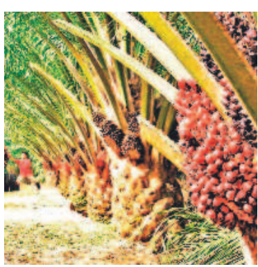
కంపెనీలు ఫెయిల్.. కర్షకులపై నిందలా? ఆయిల్ పామ్ సాగులో ప్రైవేటు కంపెనీలు విఫలమయ్యాయి. 15 కంపెనీల్లో 3 మాత్రమే లక్ష్యంలో 30 శాతం సాధించాయి. వ్యాఖ్యా ఆయిల్ అండ్ గ్యాస్ సర్వీస్ కంపెనీ 36 శాతం, వతంజి (రువి సోయ) 33 శాతం, ఆయిల్ ఫెడ్ 31 శాతం మాత్రమే సత్ఫలితాలు పొందాయి. ఆయిల్ పామ్ సాగులో కంపెనీల ఆయిల్ ఫెడ్ సరైన దిశానిర్దేశం చేయకపోవడం, ప్రణాళికల లేకపోవడం వల్ల, కంపెనీలు చతికిలయ్యాయి. కానీ ఈ నిందలను రైతులపై మోపేందుకు ప్రయత్నిస్తున్నారు. టీఆర్ఎస్

హైదరాబాద్, డిసెంబర్ 18 (నమస్తే తెలంగాణ): తెలంగాణ వ్యవసాయరంగం ముఖ్యమంత్రి జి.కే. రెడ్డి సర్కారు మార్చింది. సరికొత్త వాణిజ్య పరిశోధనా సంస్థను మళ్ళీ ఏర్పాటు చేసింది. ఇందులో భాగంగా ఆయిల్ ఫెడ్ అధ్యక్షులలో రైతులు ఆయిల్ పామ్ సాగు చేసే సాధారణ హోంబింది. సాగు నుంచి మార్కెట్ పరిస్థితుల వరకు రైతులకు దిశానిర్దేశం చేయడం వల్ల సత్ఫలితాలు సాధించింది. కానీ కాంగ్రెస్ పాలనలో ఆస్తి పంట లానే ఆయిల్ పామ్ కూడా అటర్ ఫ్లాష్ అయింది. ప్రణాళికలు ఘనం.. ఫలితాలు స్వల్పం రైతులను ఆయిల్ పామ్ సాగుపై మళ్ళించడంలో ప్రైవేటు కంపెనీలు విఫలమవుతున్నాయి. ప్రభుత్వరంగ సంస్థ ఆయిల్ ఫెడ్, ప్రైవేటు కంపెనీలు లక్ష్యానికి అనుగుణంగా పని చేయడం లేదని, తాజాగా శాఖలో స్వచ్ఛందం చేస్తున్నాయి. ఈ ఏడాది లక్ష వరకే ఆయిల్ పామ్ సాగు చేసేమని ఆయిల్ ఫెడ్ అధ్యక్షులు వెల్లడించారు. ఇప్పటివరకు 28 వేల ఎకరాల్లోనే సాగు పూర్తయింది. ఈ జిఎస్ లో 4 నెలల మిగిలి ఉంది. మరో 10-15 శాతం మాత్రమే పెరగే అవకాశం ఉంది. కాబట్టి లక్ష ఎకరాల్లో సాగు లక్ష్యాన్ని అందుకోవడం అనేకమంది వ్యవసాయ సేవకులు తీర్చిదిద్దాలన్నారు.