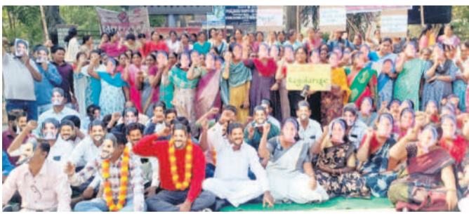
మాతికి మాస్కు పెట్టుకొని నిరసన తెలుపుతున్న ఎస్ఎస్సీ ఉద్యోగులు

గంటల నుంచి సాయంత్రం 4.30 గంటలక మార్పు చేశారు. ఈ మేరకు డీకావో, ఎంకా స్కూళ్లు పేర్కొన్నారు. తదుపరి ఆదేశాలు వచ్చే వరకు మార్చిన సమయాన్నే కొనసాగించాలని స్పష్టం చేశారు. ఈ మేరకు డీకావో, ఎంకా స్కూళ్లు పేర్కొన్నారు. తదుపరి ఆదేశాలు వచ్చే వరకు మార్చిన సమయాన్నే కొనసాగించాలని స్పష్టం చేశారు.