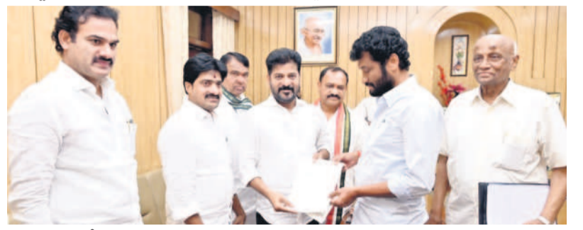
సీఎం రేవంత్ రెడ్డికి వినతిపత్రం అందజేస్తున్న బోధ ఎమ్మెల్యే అనిల్ జాదవ్

● సీఎంకె ఎమ్మెల్యే అనిల్ జాదవ్ వివరి మండలంలోని పిప్పల్కోటి ప్రాజెక్టు భూ నిర్వాసి తులకు పరిహారం అందజేయడంతోపాటు ఇచ్చోడ లో పోలీస్ సబ్ డివిజన్, తలమడుగు మండలంలోని బరంపూర్ నుంచి మార్కండ్ రోడ్డు, సిరివెల్చె, వెంబి రహదారి నిర్మాణానికి అటవీశాఖ అనుమతులు ఇప్పించాలని, సిరివెల్చె మల్కెరెడ్ల అలయం, బరంపూర్ వెంకటేశ్వర అలయాలని నిధులు మంజూరు చేయాలని కోరారు. డిగ్రీలు ప్రాజెక్టు తోపాటు ఫైర్ స్టేషన్ ఏర్పాటు చేయాలని, కుప్పీ ప్రాజెక్టు పనులు ప్రారంభించాలని కోరారు. టీఎంపూర్