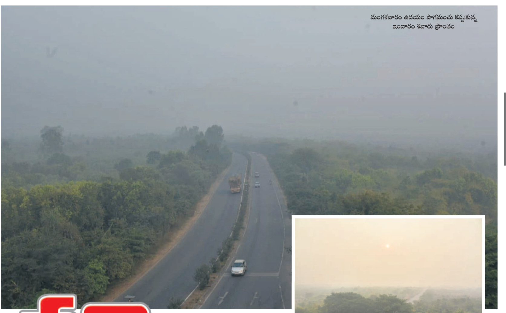
మంగళవారం ఉదయం పొగమంచు కమ్ముకున్న ఇందారం శివారు ప్రాంతం

అదిలాబాద్, డిసెంబర్ 18 (నమస్తే తెలంగాణ) : విదేశాల్లో చదువుతున్న గిరిజన విద్యార్థులకు ఉపకార వేతనాలు (టవర్స్) స్కాలర్ షిప్) అందించాలని బోధ ఎమ్మెల్యే అనిల్ జాదవ్ ప్రభుత్వాన్ని కోరారు. బుధవారం అసెంబ్లీ సమావేశాల ప్రశ్నోత్తర సమయంలో ఈ అంశాన్ని లేవనెత్తారు. కేసీఆర్ ప్రభుత్వం విదేశాల్లో ఉన్నత చదువుల కోసం విద్యార్థులకు టవర్స్ స్కాలర్ షిప్ను ప్రవేశ పెట్టిందన్నారు. ప్రస్తుతం స్కాలర్ షిప్ అందకపోవడంతో చాలి తల్లిదండ్రులు డబ్బులు బాకీలు చేస్తూ వడ్డీలు కడుతున్నారని సభ దృష్టికి తీసుకొచ్చారు. అనే విధంగా డిగ్రీ, ఇంటర్ విద్యార్థులకు స్కాలర్ షిప్ అందడం లేదని, వాటిని కూడా త్వరగా అందించాలని ప్రభుత్వాన్ని కోరారు.