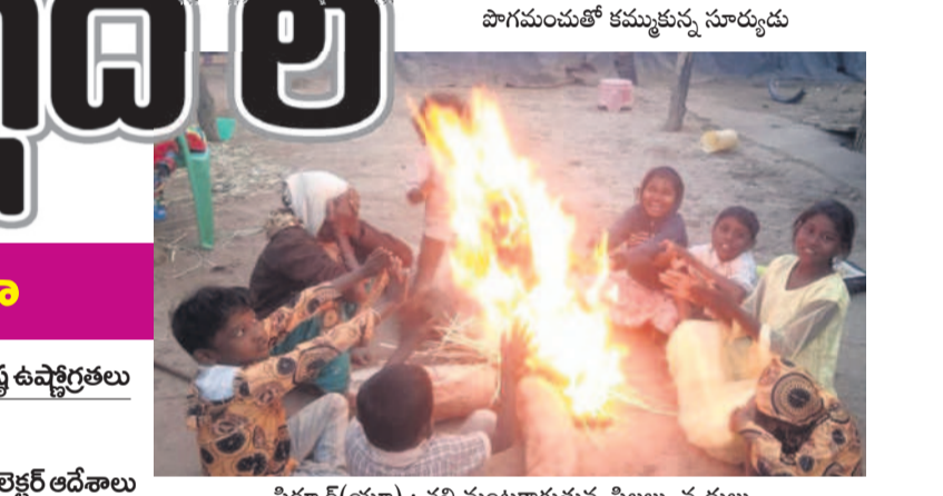
సిర్పూర్(యూ) : చలి మంటకాగుతున్న పిల్లలు, వృద్ధులు