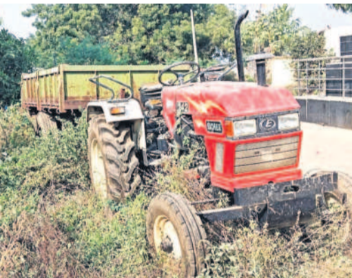
అర్వపల్లి మండలం కోమటిపల్లిలో నిరుపయోగంగా మారిన గ్రామ పంచాయతీ ట్రాక్టర్

నిత్యం చెత్తను ఎత్తిన ట్రాక్టర్లు, మొక్కలకు నీళ్లు పోసిన టాంకర్ల డీజిల్ కు కూడా డబ్బులు ఉండడం లేదని పంచాయతీ కార్యదర్శులు వాపోతున్నారు. మరోవైపు రిపరీ వచ్చిన ట్రాక్టర్లకు మరమ్మత్తులు చేయించకపోవడంతో నిరుపయోగంగా మారుతున్నాయి. మెజా నీటి గ్రామాల్లో ట్రాక్టర్లకు ఈఎంఐ చెల్లించ కపోవడంతో నోటీసుల మీద నోటీసులు వస్తుండగా అధికారులు రేపు, మాపు అంటూ కాలం సర్దిచెప్పుకొస్తున్నారు. మరోవైపు నిధులు రాకపోవడంతో ట్రీటింగ్ ప్లాంట్, విద్యుత్ బిల్లులు, తాగునీటి సరఫరా మోటార్ల మరమ్మత్తులు, విధివిపాలకు కూడా ఖర్చుపడుతున్నది.