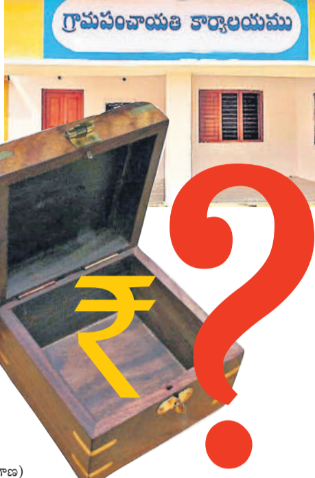
ఉద్యోగ భయంతో అప్పుల పాలు

గ్రామీణ ప్రాంతాలను సమస్యలు ఉక్కిరి బిక్కిరి చేస్తున్నాయి. పల్లెల నిర్వహణకు ఏడాది కాలంగా కాంగ్రెస్ ప్రభుత్వం నయాపైసా విధిల్లకపోవడంతో గ్రామ పంచాయతీలు అర్ధిక అవస్థలతో సతమతం అవుతున్నాయి. పాత వర్షాల వడదీ కాలు పూర్తయిన అనంతరం ప్రత్యేక అధికారులను నియమించినప్పటికీ నిధులు లేకపోవడంతో ఎక్కడెక్కడో అక్కడే ఉంటున్నాయి. ఉన్న తాదికారుల ఆదేశాలతో ఉద్యోగాలు పోగొట్టుకోలేక విధి లేక కార్యదర్శులే అప్పులు చేసి మౌలిక సదుపాయాలు కల్పిస్తున్నారు. బీఆర్ఎస్ పాలనలో పల్లె ప్రగతి పేరిట నెల నెల గ్రామపంచాయతీ లకు నిధులు అందివి. సూర్యాపేట జిల్లాకు ప్రతి నెల రూ.12 కోట్ల నుంచి 16 కోట్ల వరకూ మంజూరయ్యేవి. క్రమం తప్పకుండా నిధులు ఇవ్వడం వల్లే దశాబ్దాల తరబడి వెనుకబడిన పల్లెలు సైతం దీర్ఘకాలిక సమస్యలను పరిష్కరించుకుని కొత్త సౌలభ్యాలను సమకూర్చుకున్నాయి. కాంగ్రెస్ ప్రభుత్వం అధికారంలోకి రావడంతో పల్లెల్లో మళ్లీ మొదటికి వచ్చింది.