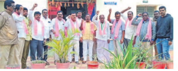
కనగల్ పోలీస్ స్టేషన్లో నిరసన తెలుపుతున్న అర్ధకర్షణ మాజీ సర్పంచులు

నల్లగొండ, డిసెంబర్ 16 : కాంగ్రెస్ ప్రభుత్వం రాష్ట్రంలో అధికారంలోకి వచ్చి ఏడాది పూర్తయిన సందర్భంగా ప్రజాపాలన పేరుతో సంఘాలను చేసుకోవడం తప్ప అప్పులు తెచ్చి గ్రామాలను అభివృద్ధి చేసిన తమకు మాత్రం బిల్లులు ఇవ్వడం లేదని ఆవేదన వ్యక్తం చేస్తూ సోమవారం మాజీ సర్పంచులు చేసే అసెంబ్లీ కార్యక్రమాన్ని నిర్వహించారు. దాంతో పోలీసులు ఉమ్మడి జిల్లా బాధా కార్యక్రమాలకు బిల్లులు ఇచ్చి,