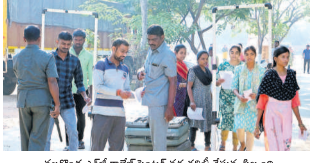
నల్లగొండ ఎన్టీకాలేజీ సెంటర్ వద్ద తనిఖీ చేస్తున్న సిబ్బంది

రామగిరి/సూర్యాపేట, డిసెంబర్ 16 : తెలంగాణ రాష్ట్ర పబ్లిక్ సర్వీస్ కమిషన్ నిర్వహించిన గ్రూప్-2 పరీక్షలు ముగిశాయి. రెండో రోజు సోమవారం పరీక్షలు సజావుగా జరిగాయి. నల్లగొండ జిల్లాలో 49.10 శాతం, సూర్యాపేట జిల్లాలో 50.24 శాతం మంది అభ్యర్థులు పరీక్షలు రాశారు. నల్లగొండ జిల్లా కేంద్రంలో పేపర్-3 పరీక్షకు 21,177 మందికిగానూ 11,284 మంది హాజరు కాగా 9,893 మంది గైర్జరయ్యారు. పేపర్-4 పరీక్షకు 11,291 మంది హాజరు కాగా 9886 మంది గైర్జరయ్యారు.