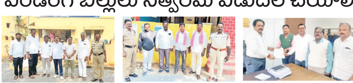
విన్నశంకరంపేట పోలీసుల అదుపులో మాజీ సర్పంచ్లు