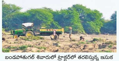
బండపోతుగల్ శివారులో ట్రాక్టర్ల తరలింపు ఇసుక

చిలిపెడ, డిసెంబర్ 16: మండలంలోని బండపోతుగల్ గ్రామంలోని నాయకుల సహకారంతో ఇసుకను ఇన్ఫర్మిటిగా మంజీరా నది నుంచి అక్రమంగా తరలిస్తున్నారు. రెండు వారాల క్రితం ఇదే గ్రామంలో అక్రమంగా తరలించిన ఇసుక డంపిలను తహసీల్దార్, రెవెన్యూ, పోలీస్ అధికారులు సీజ్ చేసి రూ. 74 వేలకు వేలం వేశారు. ఇప్పటికే మంజీరా నుంచి తరలింపు ఇసుక ట్రాక్టర్లు చర్యలు తీసుకోవాలని గ్రామస్థులు కోరుతున్నారు.