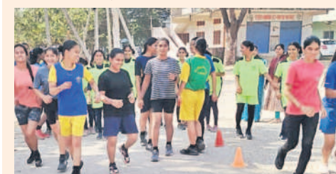
రాష్ట్ర స్థాయి పోటీలకు ఎంపికైన క్రీడాకారులు