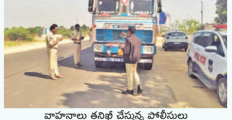
వాహనాలు తనిఖీ చేస్తున్న పోలీసులు