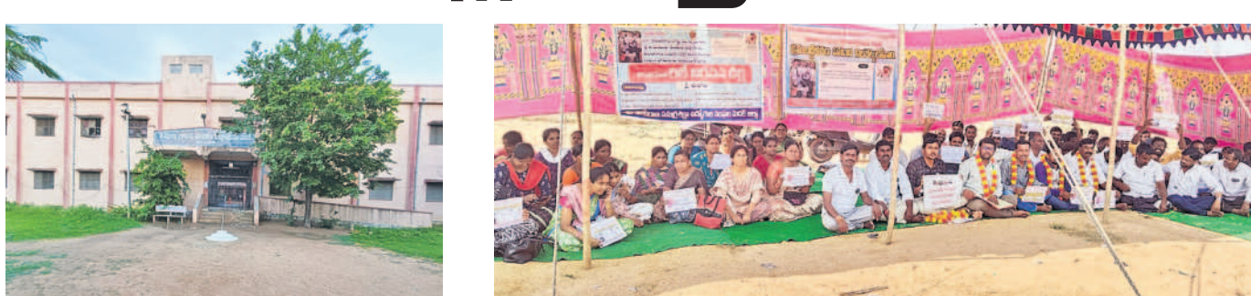
కస్తూర్బా గాంధీ బాలికల పాఠశాల, కళాశాల