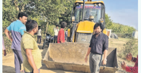
బండపోతుగల్ చెరువులో మట్టి తవ్వకం జేసిన బట్టివేత

మండలంలోని మంజీరా నది, చెరువుల్లో అనుమతులు లేకుండా మట్టి, ఇసుకను అక్రమంగా తరలించే వారిపై చర్యలు తీసుకుంటామని ఆర్ఐఎ సునీతానింగ్ చౌహాన్ హెచ్చరించారు. మండలంలోని బండపోతుగల్ గ్రామంలో అనుమతి లేకుండా చెరువుల్లో నుంచి అక్రమంగా మట్టిని తరలింపు ట్రాక్టర్, జేసీబీని ఆర్ఐఎ పట్టుకున్నారు.