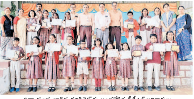
విద్యార్థులకు జ్ఞాపిక, సర్టిఫికేట్లను అందజేసిన బీడీఎల్ అధికారులు