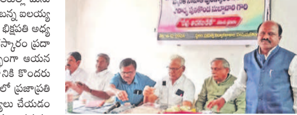
నల్లబెల్లిలో దళిత సంఘాల ఆందోళన