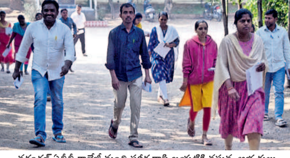
వరంగల్ వివేచి కాలేజీ నుంచి పరీక్ష రాసి బయటికి వస్తున్న అభ్యర్థులు