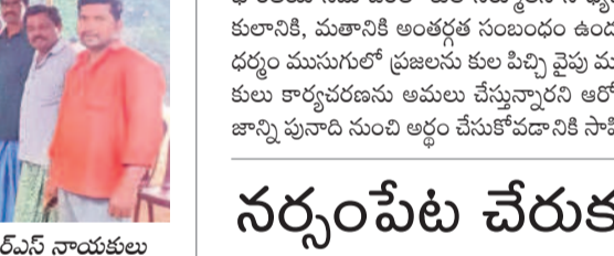
నర్సంపేట చేరుకున్న సేవాలాల్ సేన పాదయాత్ర