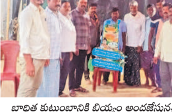
బాధిత కుటుంబానికి బియ్యం అందజేస్తున్న బీఆర్ఎస్ నాయకులు