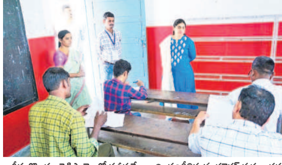
గినుగోండ : రెడ్డిపాలెంలో పరీక్ష కేంద్రాన్ని పరిశీలిస్తున్న కలెక్టర్ సత్యశాసన