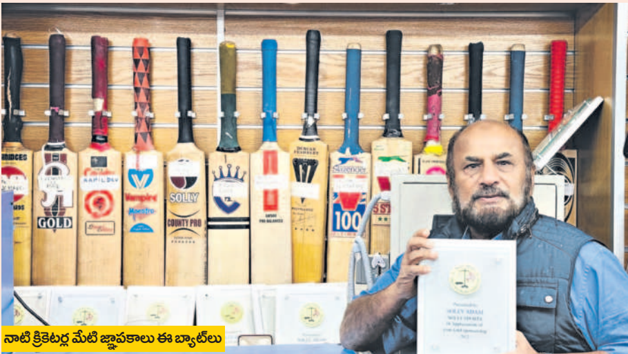
నాటి క్రికెటర్ల మేటి జ్ఞాపకాలు ఈ బ్యాట్లు