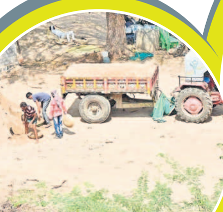
ఖమ్మం రూరల్ మండలం కరుణిగి ఎదుట ఉన్న ప్రాంతంలో అక్రమంగా నిల్వ ఉంచిన ఇసుకను తరలిస్తున్న దృశ్యం

ప్రత్యేక టాన్స్ ఫోర్స్ బృందాలు ఇలా.. గత కేసీఆర్ ప్రభుత్వం తెచ్చిన మైనింగ్ పాలసీలో భాగంగా జిల్లాలో అక్రమ మైనింగ్ ను నిలువరించేందుకు నాడు జిల్లా ఆధికార యంత్రాంగం ప్రత్యేక టాన్స్ ఫోర్స్ బృందాలను ఏర్పాటు చేసింది. జిల్లాలో రెవెన్యూ శాఖ నుంచి అడనపు కలెక్టర్ (రెవెన్యూ)/ఖమ్మం, కల్లూరు ఆర్డీవోలు, పోలీస్ శాఖ నుంచి టాన్స్ ఫోర్స్ ఏసీబీ/సీఐ, రవాణా శాఖ నుంచి డి.డి.ఎ/ఎం.పి.వ, మైనింగ్ అండ్ జియాలజీ శాఖ నుంచి అసిస్టెంట్ జియాలజిస్ట్/రాజ్యల్లీ ఇన్స్పెక్టర్ సభ్యులుగా ఉంటూ జిల్లాస్థాయి టాన్స్ ఫోర్స్ బృందాన్ని ఏర్పాటు చేశారు. మండలంలో రెవెన్యూ శాఖ నుంచి తహసీల్దార్, పోలీస్ శాఖ నుంచి ఎస్.హెచ్.ఓ, పీఆర్ నుంచి ఎం.పి.డి.ఎ.లతో మండలస్థాయి టాన్స్ ఫోర్స్ బృందాలుగా ఏర్పాటు చేశారు. ఈ బృందాలు మైనింగ్ అక్రమాలపై తనిఖీలు చేసి.. వాటిని నిలువరించి కేసులు నమోదు చేయాలి కన్నప్పటికీ ఏడాది కాలంగా కార్యచరణలోకి దిగిన పాపాన పోలేదు. చివరికి మండలం కూడా సమీక్షించి పరిస్థితి లేదు.