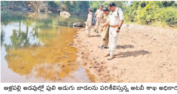
ఆళ్లపల్లి అడవులో పులి అడుగు జాడలను పరిశీలిస్తున్న అటవీ శాఖ అధికారులు

• గాంధీపులు వినిపించాయని చెబుతున్న దొంగతోగు గ్రామస్తులు • ఆనవాళ్లు సేకరించే పనిలో నిమగ్నమైన అటవీ శాఖ అధికారులు • ఒంటరిగా అడవిలోకి వెళ్లితే అధికారుల హెచ్చరిక ఆళ్లపల్లి, డిసెంబర్ 14 : సరిహద్దు జిల్లాలో సంవత్సరం విన వచ్చే పులి భద్రాద్రి కొత్తగూడెం జిల్లాలో అడుగు పెట్టినట్లు తెలుస్తున్నది. శనివారం తెల్లవారుజామున పులి గాంధీపులు విన వినిపించినట్లు ఆళ్లపల్లి మండలం దొంగతోగు గ్రామస్తులు చెబుతూ ఆందోళన చెందుతున్నారు. గ్రామస్తులు ఇప్పటి సమాచారంతో అటవీ శాఖ అధికారులు గుండాలు రేణుక పరిధిలోని దొంగతోగు అటవీ ప్రాంతంలో పులి ఆనవాళ్లు తెలుసుకునే పనిలో నిమగ్నమయ్యారు. నిన్న, మొన్నటి వరకు ములుగు జిల్లా మంఠపేట, తాడూరు, కరక గూడెం అడవుల్లో సంవత్సరం వుంటే.. అక్కడి నుంచి సరిహద్దున ఉన్న గుండాలు అటవీ రేణుక పరిధిలోకి అడుగు పెట్టడంతో ప్రజలు తీవ్ర భయాందోళనలకు గురవుతున్నారు. ఈ క్రమంలో దొంగతోగు, ముల్లూపురం, నల్లపల్లి, నడిమిగుండె గ్రామాల రైతులు శనివారం చేసి, పాలం పనులకు వెళ్లాలంటే జంతువులు, దొంగతోగు గ్రామానికి కిచ్చారసాని అభయారణ్యం దగ్గరగా ఉంటుంది. దీంతో ఈ ప్రాంతంలోనే పెద్దపులి సంవత్సరం సమాచారం. అయితే అడవిలోకి ఒంటరిగా వెళ్లితే, చేసే పనులకు వెళ్లిన వారు ఆళ్లపల్లి అడవులో పులి అడుగు జాడలను పరిశీలిస్తున్న అటవీ శాఖ అధికారులు