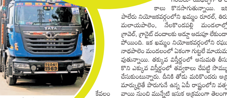
ఖమ్మం అర్బన్ పోలీస్ స్టేషన్ ఎదుట నిలిచి ఉంచిన ఇసుక లాల్లి

డిప్యూటీ సీఎం ఇల్లాకాలో అనంతం.. ఉప ముఖ్యమంత్రి ఇల్లాకాలో మైనింగ్ అక్రమాల అనంతంగా బయటి కొస్తున్నాయి. ఇసుక వనరులు అధికంగా ఉన్న మధిర నియోజకవర్గం నుంచే అక్రమ ఇసుక దందా మొదలైంది. గత కేసీఆర్ సర్కారులో కేవలం ప్రభుత్వ పనులు, డబుల్ బెడ్రూం ఇళ్ల నిర్మాణాల కోసం అధికారులు ఇసుక కూపస్ను జారీ చేసినా, కారిక అనుమతులు ఏమీ లేవు. చైరా నది, ఎర్ర