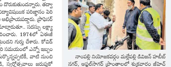
నాంపల్లి నియోజకవర్గం మల్లపల్లి డివిజన్ పోలీస్ స్టేషన్లో నిర్వహించిన ప్రజాపాలనా పరిషత్తును ఏర్పాటు చేయాలని అన్నారు. దీనిని వ్యతిరేకిస్తూ ప్రభుత్వం నుండి దీనిని తప్పు అనుభవం వ్యాఖ్యలు చేశారు. సీఎం దేవేంద్రుని బీసీలకు ఇబ్బందులు తెలుస్తాయని వివరిస్తూ చట్టసభలో బీసీలకు రిజర్వేషన్లు కల్పించేందుకు తీర్మానం ప్రవేశపెట్టి, ఏకగ్రీవంగా అమోదించి కేంద్రానికి వివేచించి, బీసీలకు చట్ట సభలోని నిరూపించుకోవాలని కోరారు. బీసీ నాయకులు పాల్గొన్నారు.