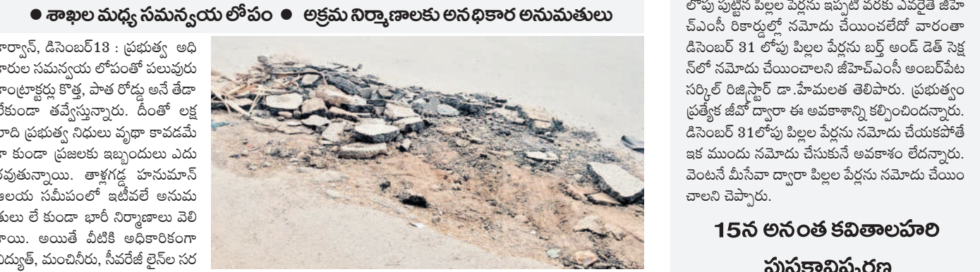
శాశ్వత హనుమాన్ ఆలయం ఎదురు ప్రధాన రోడ్లను తవ్వకం నిర్వహిస్తున్నారు.

రహదారుల అభివృద్ధికి ప్రభుత్వం కృషి చేయాలని అన్నారు. దీనిని వ్యతిరేకిస్తూ ప్రభుత్వం నుండి దీనిని తప్పు అనుభవం వ్యాఖ్యలు చేశారు. సీఎం దేవేంద్రుని బీసీలకు ఇబ్బందులు తెలుస్తాయని వివరిస్తూ చట్టసభలో బీసీలకు రిజర్వేషన్లు కల్పించేందుకు తీర్మానం ప్రవేశపెట్టి, ఏకగ్రీవంగా అమోదించి కేంద్రానికి వివేచించి, బీసీలకు చట్ట సభలోని నిరూపించుకోవాలని కోరారు. బీసీ నాయకులు పాల్గొన్నారు.