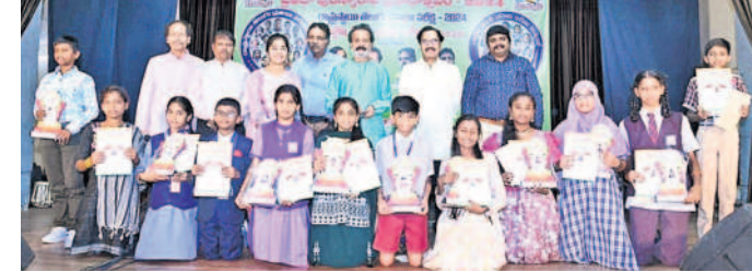
ప్రతిభ కనబరిచిన విద్యార్థులకు బహుమతులను పంపిణీ చేసిన వక్రలు