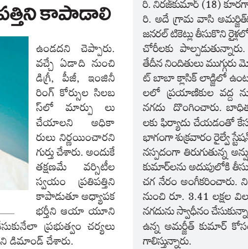
వర్ధిల్లిన వసువతి ప్రభుత్వం చర్యలు నాణ్యమైన ఉన్నత విద్య అందించే అవకాశం

ఉస్మానియా యూనివర్సిటీ, డిసెంబర్ 13 : యూనివర్సిటీలు స్వయం ప్రతిపత్తిని కాపాడాలి అన్నారు. ప్రభుత్వం నిర్దేశించిన మార్గదర్శిని అనుసరించాలి అన్నారు.