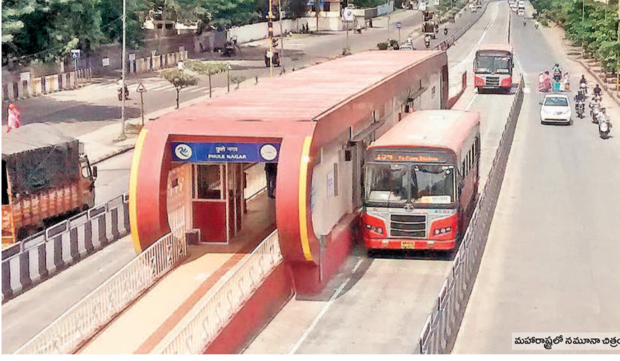
మహారాష్ట్రలో నమూనా చిత్రం

మెట్రో విస్తరణకు అనుకూలంగా లేని, జనసందారం ఎక్కువగా ఉండే ప్రాంతాల్లో ఎబివెటిడ్ బస్ ర్యాపిడ్ ట్రాన్స్పోర్టులను నిర్మించాలని హైదరాబాద్ అర్బన్ మెట్రోపాలిటన్ ట్రాన్స్పోర్టు అథారిటీ ప్రత్యేక నివేదిక రూపొందించింది. ఇందులో భాగంగా నగరంలో మొదట దశలో దాదాపు 70 కిలోమీటర్ల మేర మెట్రో అందుబాటులోకి వచ్చింది. కానీ ఎప్పుడో నిర్మించాల్సిన బీఆర్టీఎస్ ప్రాజెక్టును కాంగ్రెస్ సర్కారు కాగితాలకే పరిమితం చేసింది. గతంలో బీఆర్ఎస్ ప్రభుత్వం ఈ ప్రాజెక్టు విషయంలో ఉన్నత స్థాయి సమీక్ష సమావేశం ద్వారా రూ.3 వేల కోట్ల అంచనా వ్యయంతో తొలి దశలో 22 కిలోమీటర్ల మేర ఈబీఆర్టీఎస్ నిర్మించాలని ప్రతిపాదించింది. దీనికి అనుగుణంగా భూసేకరణ, ప్రాజెక్టు డిజైన్లు, రూట్ మ్యాప్, మెట్రో అనుసంధానం వంటి అంశాలతో పకడ్బందీ ప్రణాళికలను సిద్ధం చేసింది. కాంగ్రెస్ ప్రభుత్వం పాత ప్రణాళికలను పక్కనపెట్టేలా.. మెట్రో విస్తరణ పేరిట ఫోర్ట్ సిటీకి మళ్ళించింది.