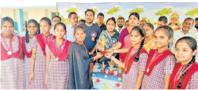
కొడిపల్లిలో విద్యార్థులకు బహుమతులు అందజేస్తున్న ఎమ్మెల్యే సునీతాలక్ష్మారెడ్డి