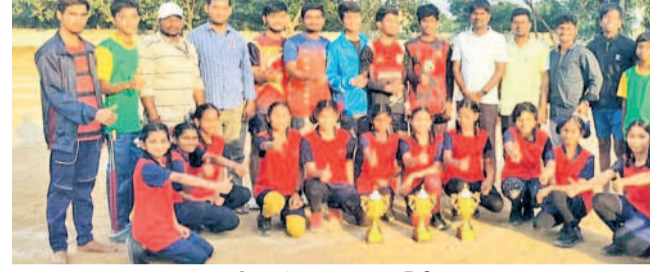
జిల్లా స్థాయికి ఎంపికైన నర్సాపూర్ గిరిజన గురుకుల విద్యార్థులు