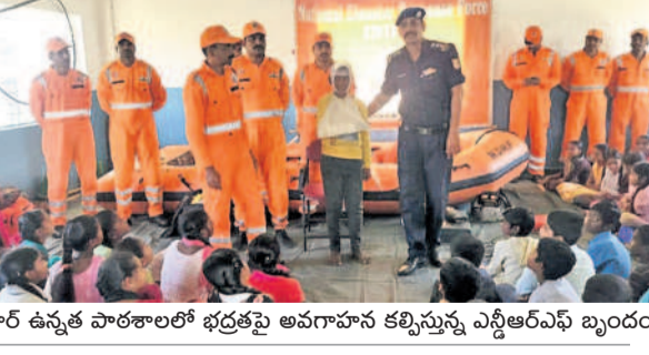
కుకునూర్ ఉన్నత పాఠశాలలో భద్రతపై అవగాహన కల్పిస్తున్న ఎన్సీఆర్ఎఫ్ బృందం

వెల్చి, డిసెంబర్ 12: పాఠశాలలో ఆకస్మాత్తుగా సంభవించే విపత్తులను ఎదుర్కోవడంలో పాటు తీసుకోవాల్సిన జాగ్రత్తలపై ఎన్సీఆర్ఎఫ్ బృందం విద్యార్థులకు అవగాహన కల్పించారు. భూకంపాలు, అగ్నిప్రమాదాలు, వరదలు వచ్చినప్పుడు తమను తాము కాపాడుకోవడంలో పాటు ఇతరులను ఎలా రక్షించాలి, ప్రభుత్వం హెచ్చరికలకు జారీ చేసిన వార్తలను తీసుకోవాల్సిన జాగ్రత్తలపై విద్యార్థులకు అవగాహన కల్పించారు. భూకంపాలు, అగ్నిప్రమాదాలు, వరదలు వచ్చినప్పుడు తమను తాము కాపాడుకోవడంలో పాటు ఇతరులను ఎలా రక్షించాలి, ప్రభుత్వం హెచ్చరికలకు జారీ చేసిన వార్తలను తీసుకోవాల్సిన జాగ్రత్తలపై విద్యార్థులకు అవగాహన కల్పించారు. భూకంపాలు, అగ్నిప్రమాదాలు, వరదలు వచ్చినప్పుడు తమను తాము కాపాడుకోవడంలో పాటు ఇతరులను ఎలా రక్షించాలి, ప్రభుత్వం హెచ్చరికలకు జారీ చేసిన వార్తలను తీసుకోవాల్సిన జాగ్రత్తలపై విద్యార్థులకు అవగాహన కల్పించారు.