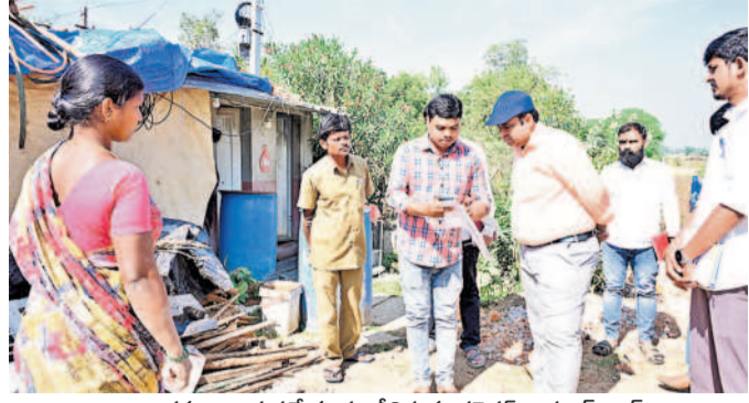
ఇందిరమ్మ ఇండ్ల సర్వేను పరిశీలిస్తున్న కలెక్టర్ రాహుల్ రాజ్

పాపన్నపేట, డిసెంబర్ 12: ప్రభుత్వ దావా ఖానల్లో విడుదల నిర్వహించే వైద్యులు, సిబ్బంది సమయపాటు పాలించాలని, ప్రజలకు మెరుగైన వైద్య సేవలందించాలని కలెక్టర్ రాహుల్ రాజ్ ఆదేశించారు. గురువారం మండలంలోని పాపన్నపేట పీహెచ్సీని తనిఖీ చేశారు. సిబ్బంది అటెండెన్స్, వివిధ రకాల పుస్తకాల పరిశీలించారు. గైడ్లైన్లను అనుసరించి సరిగ్గా పాటించాలని ఆదేశించారు. అనంతరం ఇందిరమ్మ ఇండ్ల సర్వేను పరిశీలిస్తున్న కలెక్టర్ రాహుల్ రాజ్ ఆదేశించారు.