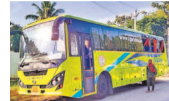
రామాయంపేట జాతీయ రహదారిలో ప్రమాదానికి గురైన రాజధాని బస్సు

రామాయంపేట, డిసెంబర్ 12: ఆర్టీసీ రాజధాని ఎక్స్ప్రెస్ బస్సును బోరు లాల్ ఢీకొన్న మంట రామాయంపేట పోలీస్ స్టేషన్ పరిధిలోని జాతీయ రహదారిలో గురువారం జరిగింది. పోలీసులు తెలిపిన వివరాల ప్రకారం.. నిజామాబాద్ నుంచి హైదరాబాద్కు ఆర్టీసీ రాజధాని ఎక్స్ప్రెస్ బస్సు వెళ్తున్నది. మా గడ్డమద్దలలోని రామాయంపేట జాతీయ రహదారి వద్ద ఎక్స్ప్రెస్ బస్సులారీ వెనుక నుంచి ఢీకొట్టింది. ఈ ప్రమాదంలో బస్సు వెనుక భాగం దెబ్బతిన్నది. దీంతో ముగ్గురు ప్రయాణికులకు తీవ్రగాయాలయ్యాయి. వారిని