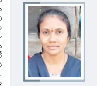
మాకు న్యాయం చేయాలి