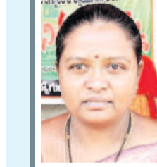
ఇచ్చిన మాట నిలబెట్టుకోవాలి

ఎన్నికల ముందు కాంగ్రెస్ నాయకులు ఇచ్చిన మాటను నిలబెట్టుకోవాలి. సమగ్ర శిక్ష ఉద్యోగులను రెగ్యులర్ చేస్తామని చెప్పి ఇప్పుడు మొబల వాటిస్తున్నారు. చాలి చాలని జీతం, అదనపు పని భారంతో మానసికంగా ఒత్తిడికి గురవుతున్నారు. మాకు పే స్కేల్ అమలు చేయాలి. ప్రభుత్వోద్యోగులతో సమానంగా పని చేస్తున్నాం. న్యాయమైన డిమాండ్లను నెరవేరచేయడం అందోళనలు ఉధృతం చేస్తాం.