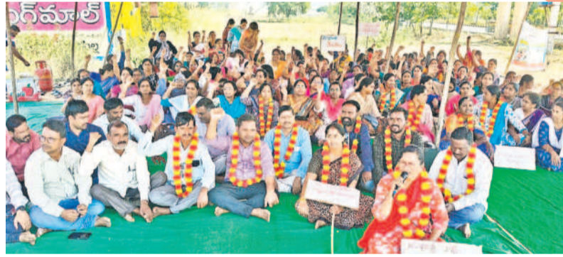
నిద్రలోనే మండలం రగుడు ఇంజనీ వద్ద రిలేట్ చేస్తూ రాజన్న సిరిసిల్ల సమగ్ర శిక్ష ఉద్యోగులు