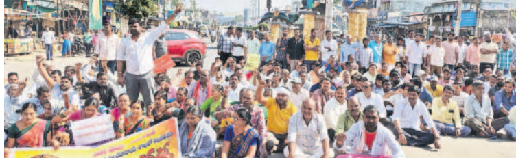
మెట్లపల్లిలో జాతీయ రహదారిపై రాస్ట్రోకో చేస్తున్న గ్రామస్థలు

• వెల్లుల్ల గ్రామస్థల డిమాండ్ • మెట్లపల్లి వరకు పాదయాత్ర.. రాస్ట్రోకో