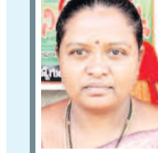
ఇచ్చిన మాట నిలబెట్టుకోవాలి