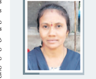
మాకు న్యాయం చేయాలి