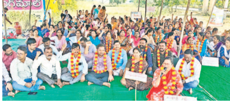
నిద్రలోనే మండలం రగుడు ఇంజనీర్ వద్ద రిలేట్ చేశారో పాల్గొన్న సమగ్ర శిక్ష ఉద్యోగులు