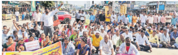
మేట్లపల్లిలో జాతీయ రహదారిపై రాస్ట్రాకో చేస్తున్న గ్రామస్థులు

• వెల్లుల్ల గ్రామస్థల డిమాండ్ • మేట్లపల్లి వరకు పాదయాత్ర.. రాస్ట్రాకో