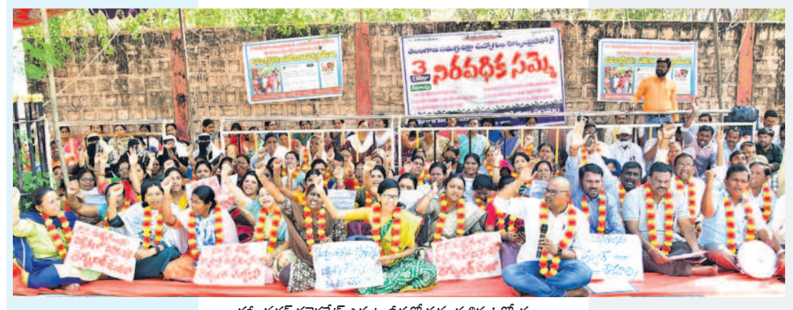
కరీంనగర్ కలెక్టరేట్ ఎదుట దీక్షలో సమగ్ర శిక్ష ఉద్యోగులు