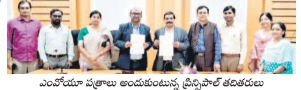
ఎంపీలూ పత్రికా అందుకుంటున్న ప్రెసిడెంట్ తదితరాలు