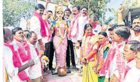
తలమడుగు: తెలంగాణ తల్లి విగ్రహానికి పాలాబిషేకం చేస్తున్న బీఆర్ఎస్ నాయకులు