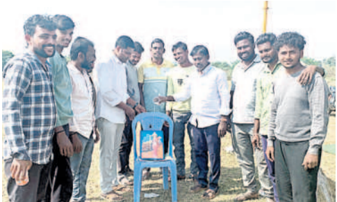
బజార్ హత్వారు: తెలంగాణ తల్లి చిత్రపటానికి పాలాబిషేకం చేస్తున్న నాయకులు