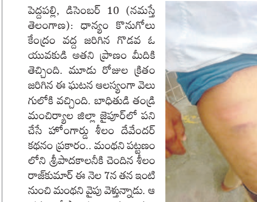
రాజ్ కుమార్ తోడెపై గాయాలు