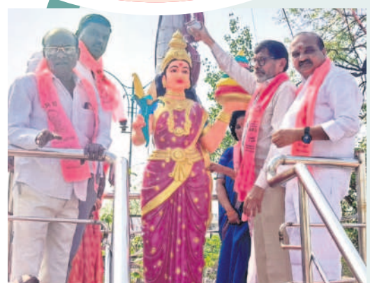
సినిలిల్ టౌన్: తెలంగాణ తల్లి విగ్రహానికి పంచామృతాభిషేకం చేస్తున్న కేటీఆర్ కేంద్రం నాయకులు