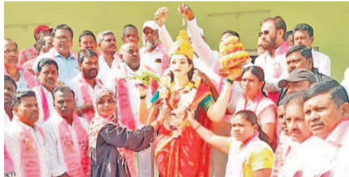
అదిలాబాద్ జిల్లా కేంద్రంలో తెలంగాణ తల్లి విగ్రహానికి పూజలూ చేస్తున్న మాజీ మంత్రి జోగారామన్న, బీఆర్ఎస్ నాయకులు, మహిళలు