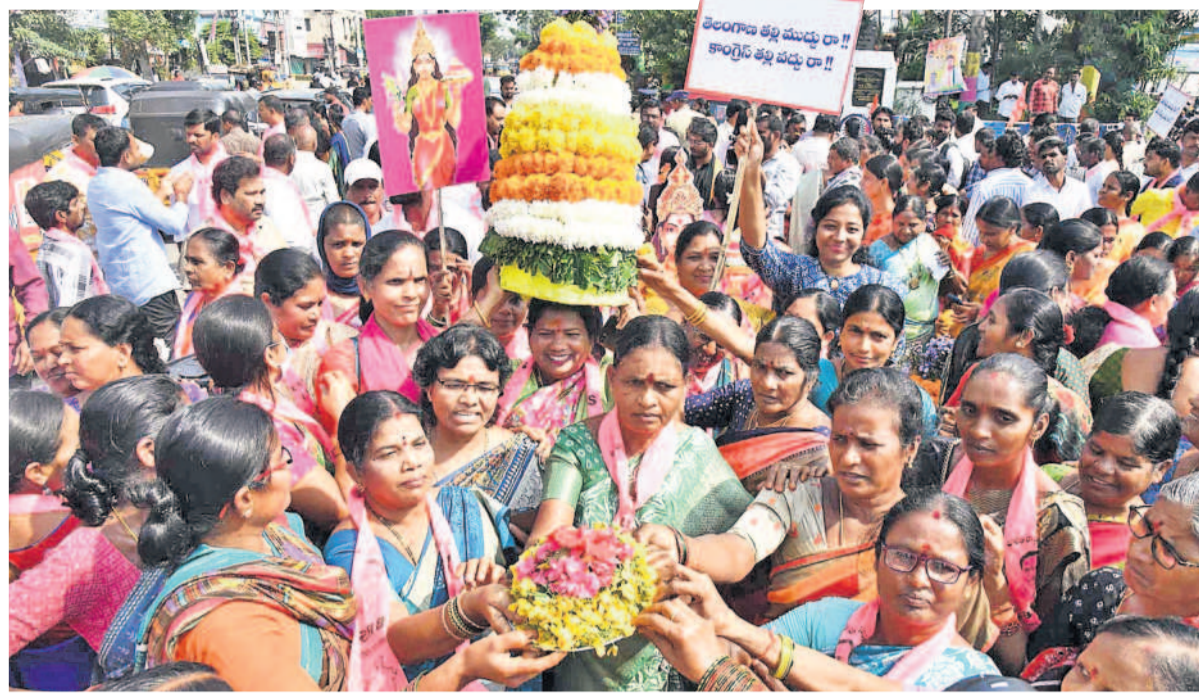
సిద్దిపేటలో బతుకమ్మలతో నిరసన చేపడుతున్న మహిళలు, బీఆర్ఎస్ శ్రేణులు తదితరులు