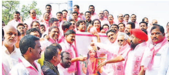
కరీంనగర్ జిల్లా కేంద్రంలోని వన్ టౌన్ పోలీస్ స్టేషన్ వారసత్వ తెలంగాణ తల్లి ఫెక్సిటీ క్షీరాభిషేకం చేస్తున్న బీఆర్ఎస్ నాయకులు తదితరులు