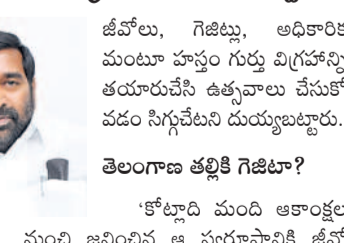
జీవో, గెజిట్లు, అధికారిక మంటూ హస్తం గుర్తు విగ్రహాన్ని తయారుచేసి ఉత్సవాలు చేసుకోవడం అనేది తెలంగాణ తల్లిని అవమానించడం.