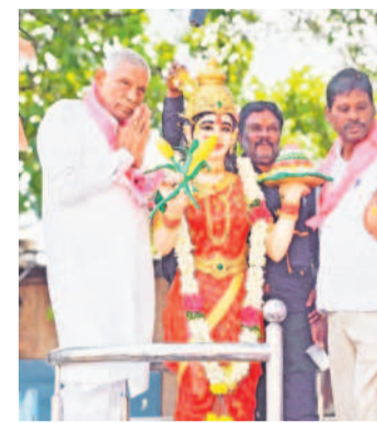
మంచిర్యాలలో తెలంగాణ తల్లి విగ్రహానికి నమస్కరిస్తున్న బివాకర్ రావు

ఆశా వర్కర్లకు ఇచ్చిన హామీలను తక్షణమే లమలు చేయాలని ఎమ్మెల్యే కవిత డిమాండ్ చేశారు. కేసీఆర్ ముఖ్యమంత్రిగా ఉన్నప్పుడు సుకోవాలని సీఎంకె సూచించారు.