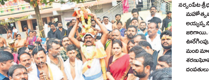
నెయ్యితో అయ్యప్పకు అభిషేకం చేస్తున్న గురుస్వామి

ఉప్పులలో రెండు రోజులుగా కొనసాగుతున్న పునరుద్ధరణ పనులు కమలాపూర్, డిసెంబర్ 9 : మండలంలోని ఉప్పుల రైల్వే స్టేషన్ సమీపంలో ఏర్పడిన సాంకేతిక లోపంతో రైళ్ల హార్టింగ్ ను అధికారులు నిలిపివేశారు. ఈ నెల 8న ఉదయం 9.30 గంటలకు టెక్నికల్ ప్రాబ్లంట్ సిగ్నల్స్ వ్యవస్థ దెబ్బతింది. దీంతో రైల్వే అధికారులు వెద్ద ఎత్తున ఉప్పులకు వేరుకని సిగ్నల్స్ వ్యవస్థను పునరుద్ధరించేందుకు మరమ్మతులు చేపట్టారు. పనులు జరుగుతుండడంతో రైల్వే స్టేషన్లో బ్యాన్ వేశారు, ఇంటిసిటీ,