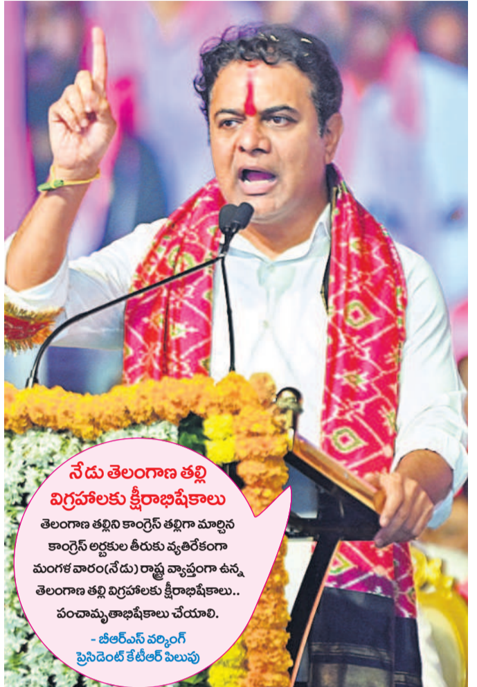
నేడు తెలంగాణ తల్లి విగ్రహాలకు క్షీరాభిషేకాలు తెలంగాణ తల్లిని కాంగ్రెస్ తర్జివా మూలన కాంగ్రెస్ అధ్యక్షుల తీరుకు వ్యతిరేకంగా మంగళవారం(నేడు) రాష్ట్ర వ్యాప్తంగా ఉన్న తెలంగాణ తల్లి విగ్రహాలకు క్షీరాభిషేకాలు.. పంచామృతాభిషేకాలు చేయాలి. - బీఆర్ఎస్ వర్కర్స్ ప్రెసిడెంట్ కేటీఆర్ పిలుపు