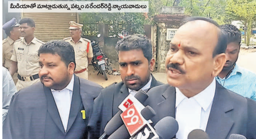
మీడియాతో మాట్లాడుతున్న పట్ల నరేందర్ రెడ్డి న్యాయవాదులు

మార్కులు తగ్గితే చర్యలే..! సిటీబ్యూరో, డిసెంబర్ 9 (నమస్తే తెలంగాణ) : హైదరాబాద్ లోని ఎమ్మార్వో కార్యాలయాల్లో సీపీఎస్ ఐ విభాగం అందుతున్నాయి? నిర్ణీత సమయంలోపు సంబంధిత డ్రువర్లకు జారీ అవుతున్నాయి? వెండింగ్లో దరఖాస్తులకు కారణాలు? ఇలా తదితర అంశాలపై ఎమ్మార్వో వివరాలు సేకరించి సదరు కార్యాలయాలకు డిప్యూటీ కలెక్టర్లు మార్కులు ఇస్తున్నారు. ఆ మార్కుల ఆధారంగా సిబ్బందిపై చర్యలు తీసుకోవచ్చునన్నారు. హైదరాబాద్ కలెక్టర్ అదేశాలనుసరించి డిప్యూటీ కలెక్టర్ల వారానికి మూడు ఎమ్మార్వో కార్యాలయాలను