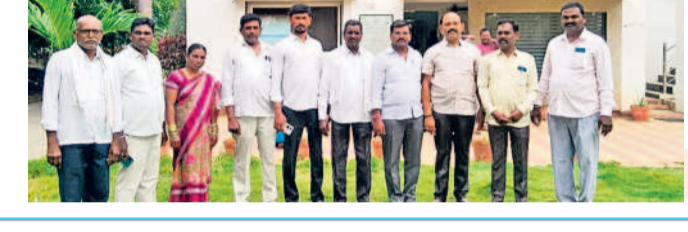
హనుమకొండ పోలీస్ స్టేషన్లో..