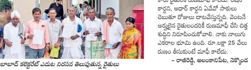
మహబూబాబాద్ కలెక్టర్ కేంద్రం ఎదుట నిరసన తెలుపుతున్న రైతులు

చేశారు. రెండు నెలల నుంచి బ్యాంకులు, వ్యవసాయ అధికారులకు అధికారం వారికి ఉన్నా, పాస్ బుక్స్ జిర్కాల్లు ఇస్తున్నారు మాఫీ మాత్రం కావడం కాలేదని పేర్కొన్నారు. రేపన్ కార్డ్ లేదని, అధార్ కార్డ్ చేరు తప్పగా ఉందని సాకులు చెబుతున్నారని, ప్రభుత్వం కూడా సమస్యలను పరిష్కరించకుండా ఇబ్బందులు పెడుతున్నదన్నారు. అనంతరం అదనపు కలెక్టర్ జి సంద్యారాణి, బీర దంతో మాఫీ జరగలేదని ఆగ్రహం వ్యక్తం