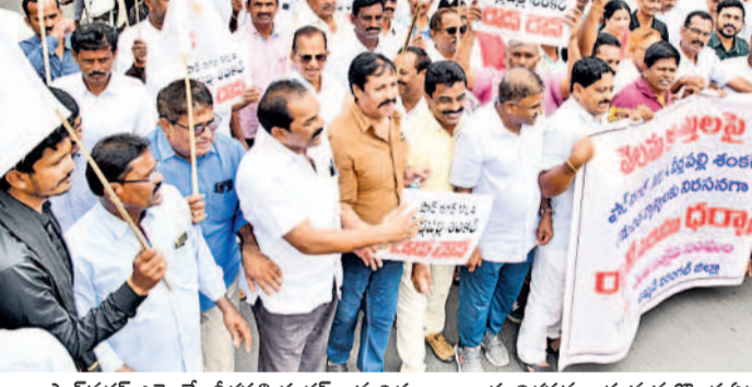
షాద్ నగర్ ఎమ్మెల్యే వీధిపల్లి శంకర్ అనుచిత వ్యాఖ్యలకు నిరసనగా హనుమకొండ ఏకశిల పార్టీ నుంచి కలెక్టర్ కేంద్రం వరకు రాల్చి నిర్వహిస్తున్న వెలమ కల సంఘం నాయకులు

కాంగ్రెస్ ఎమ్మెల్యే శంకర్ కు ఉమ్మడి వరంగల్ వెలమ కులస్తుల హెచ్చరిక భీష్మరతుగా క్షమాపణ చెప్పాలని డిమాండ్ ధర్నా, రాల్చి నిర్వహించి కలెక్టర్ కేంద్రం ఎదుట ఎమ్మెల్యే దిష్టిబొమ్మ దహనం