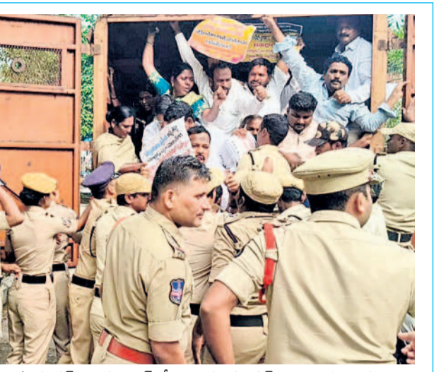
జనగామ రూరల్ : హైదరాబాద్ లోని ఎన్నికల కమిషన్ కార్యాలయం ఎదుట నిరసన తెలుపుతున్న జనగామ జిల్లా మాజీ సర్పంచులను అరెస్టు చేస్తున్న పోలీసులు