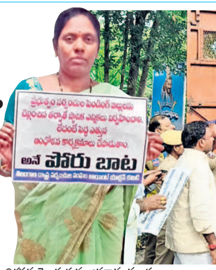
నిరసన తెలుపుతున్న జనగామ మండల సర్పంచుల పోలీస్ స్టేషన్లో..

మాజీ సర్పంచ్ల ముందస్తు అరెస్టులు చలో అసెంబ్లీకి వెళ్లకుండా అడ్డుకున్న పోలీసులు సమస్య నెట్వర్క్, డిసెంబర్ 9: పెండింగ్ బిల్లులు వెంటనే చెల్లించాలని మాజీ సర్పంచ్ల సోమవారం చలో అసెంబ్లీకి పిలుపునిచ్చగా ఉమ్మడి జిల్లావ్యాప్తంగా పోలీసులు వారిని అదుపులోకి తీసుకున్నారు. ముందస్తుగా అరెస్టు చేసి పోలీస్ స్టేషన్లకు తరలించారు. ఈ సందర్భంగా మాజీ సర్పంచ్లు మాట్లాడుతూ గ్రామాల అభివృద్ధికి తాము అప్పులు చేసి పనులు చేపామని, తమకు రావాల్సిన బిల్లులను కాంగ్రెస్ ప్రభుత్వం విడుదల చేయకుండా మానసిక క్షోభకు గురిచేస్తున్నదని అన్నారు. బిల్లులు చెల్లించాలని నిరసన తెలిపేందుకు బయలుదేరిన తమను నిర్బంధించడం దారుణమన్నారు. సీఎం రేవంత్ రెడ్డి రాష్ట్రంలో పోలీసు పాలన నడిపిస్తున్నారని మండిపడ్డారు. రాష్ట్ర ప్రభుత్వం ప్రభుత్వే వారి గొంతు నొక్కతూ నిరంకుశంగా వ్యవహరిస్తున్నదని పేర్కొన్నారు. వెంటనే పెండింగ్ బిల్లులను విడుదల చేయాలని వారు డిమాండ్ చేశారు.