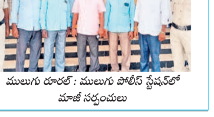
ములుగు రూరల్ : ములుగు పోలీస్ స్టేషన్లో మాజీ సర్పంచులు