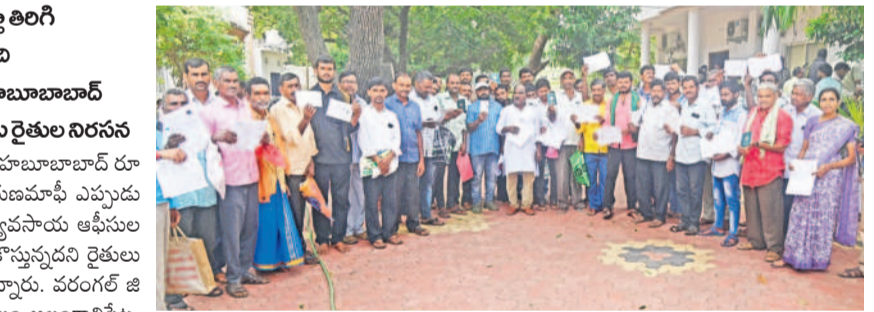
వరంగల్ కలెక్టర్ కేంద్రం ఎదుట ధర్నా చేస్తున్న నెక్రోడ మండలం అలంకానిపేట రైతులు

అఫీసుల చుట్టూ తిరిగి యాభ్యుక్తిస్తున్నది వరంగల్, మహబూబాబాద్ కలెక్టర్లు ఎదుట ధర్నా చేస్తున్న నెక్రోడ మండలం అలంకానిపేట రైతులు బీలావరంగల్/మహబూబాబాద్ రూరల్, డిసెంబర్ 9: రుణమాఫీ ఎప్పుడు చేస్తారు? బ్యాంకు, వ్యవసాయ ఆఫీసుల చుట్టూ తిరిగి యాభ్యుక్తిస్తున్నది రైతులు ఆవేదన వ్యక్తం చేస్తున్నారు. వరంగల్ జిల్లా నెక్రోడ మండలం అలంకానిపేట, మహబూబాబాద్ మండలం మాధవపురం, కురవి మండలం బంజారాతండా రైతులు ఆయా జిల్లాల కలెక్టర్లకు ఎదుట సోమవారం నిరసన తెలిపారు. అర్జున రైతులకు రుణమాఫీ చేయకుండా కాంగ్రెస్ ప్రభుత్వం కాలయాచన చేస్తున్నదన్నారు. నెక్రోడలోని ఐపీటీఓ 1500 మంది రైతులకు ఖాతాబండ్లగా ఇందులో 600 మందికి మాత్రమే రుణమాఫీ జరిగిందన్నారు. మిగతా 900 మందికి అధికారుల తప్పిదంతో మాఫీ జరగలేదని ఆగ్రహం వ్యక్తం