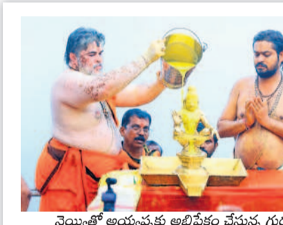
నెయ్యితో అయ్యప్పకు అభిషేకం చేస్తున్న గురుస్వామి

సిగ్నల్స్ కాగజేసగర్ ఎక్స్ ప్రెస్, సింగిడి, రామగిరి ప్యాసింజర్ రైళ్ల హాల్టింగ్ ఎత్తివేశారు. దీంతో ఉప్పులూరి నుంచి వివిధ ప్రాంతాలకు వెళ్లాల్సిన ప్రయాణికులు తీవ్ర ఇబ్బందులు పడ్డారు. అధికారులు రైల్వేగేట్ ఇంటర్ లాక్ ఓపెన్ చేయడంతో పరకాల-చుజారా బాద్ రహదారిపై వాహనాలు యధావిధిగా నడుస్తున్నాయి. రెండు రోజులుగా సిగ్నల్స్ పునరుద్ధరించేందుకు తీవ్రంగా శ్రమిస్తున్నారు. కాగా తాత్కాలికంగా మెయిన్ ట్రాక్ సిగ్నల్స్ కనెక్ట్ ఇప్పి నడిపిస్తున్నారు.