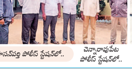
చెన్నారావుపేట పోలీస్ స్టేషన్లో..