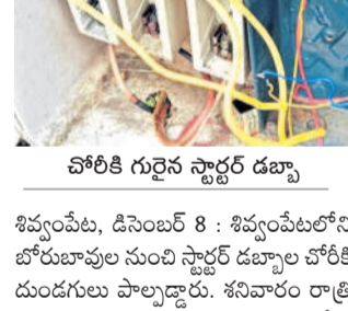
చోరీకి గురైన స్టాల్లర్ల డబ్బాలు

శివ్వంపేట, డిసెంబర్ 8: శివ్వంపేటలోని బోరుబావుల నుంచి స్టాల్లర్ల డబ్బాల చోరీకి దుండగులు పాల్పడ్డారు. శనివారం రాత్రి బావుల స్టాల్లర్ల డబ్బాలు, విద్యుత్ పరికరాలు అక్కరెక్కారు. యానంగి సాగుకు సన్నద్ధం చేస్తున్న తరుణంలో బోరుబావులకు సంబంధించిన స్టాల్లర్ల డబ్బాలు చోరీ చేయడంతో మాట్లాడుతున్న నడవడం రైతులు ఇబ్బందులు గురవుతున్నారు.