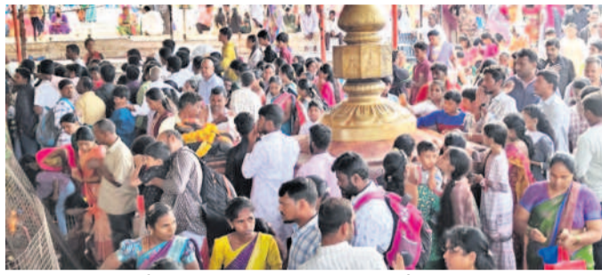
ఏడుపాయల వనదుర్గామాత సన్నిధిలో భక్తులు