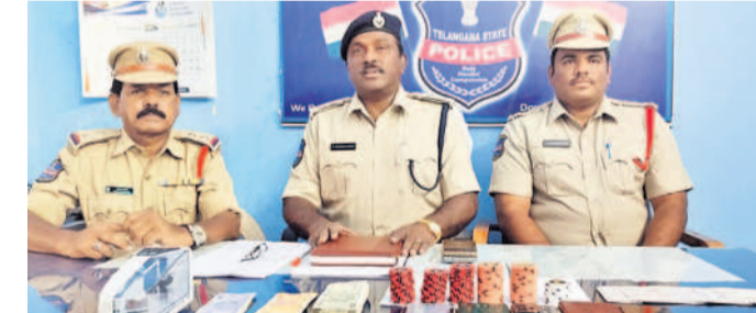
కొల్లూరు పోలీస్ స్టేషన్లో మాట్లాడుతున్న మెడక్ డీఎస్పీ ప్రసన్నకుమార్

కొల్లూరు, డిసెంబర్ 8: మండలంలోని పేకాడు తున్న 11 మంది అరెస్టు చేశారు. పేకాడు తున్న 11 మంది అరెస్టు చేశారు. పేకాడు తున్న 11 మంది అరెస్టు చేశారు. పేకాడు తున్న 11 మంది అరెస్టు చేశారు. పేకాడు తున్న 11 మంది అరెస్టు చేశారు.