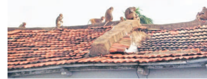
అక్కన్నపేటలో ఇంటిపై కోతుల వీరంగం