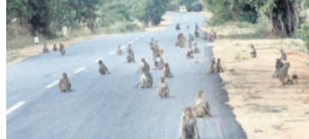
రామాయంపేట రోడ్డుపైనే కోతుల గుంపు