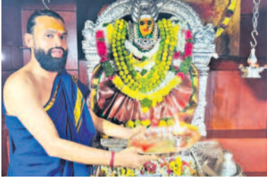
పూజలందుకుంటున్న దుర్గామాత అమ్మవారు