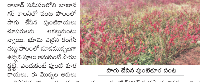
సాగు చేసిన పుంటికాయల పంట

జూహిరాబాద్, డిసెంబర్ 8: జూహిరాబాద్ సమీపంలోని బాబానగర్ కాలనీలో పంట పొలంలో సాగు చేసిన పుంటికాయలు చూపరులకు ఆకట్టుకుంటున్నాయి. భూమి ఎర్రని రంగుని నట్టు పొలంలో చూడటంపట్టగా ఉన్నది పూలు అనుకుంటే పొరబడ్డట్లే. ఎందుకంటే పుంటికాయల కాయలు. ఈ మొక్కల కాయలు రాలిపోవడంతో కాండం నుంచి కాయల రంగు కనిపిస్తూ ఆకట్టుకుంటున్నాయి. పొల్లూరు జూహిరాబాద్ డిసెంబర్లో కోతుల వస్తుందని జూహిరాబాద్