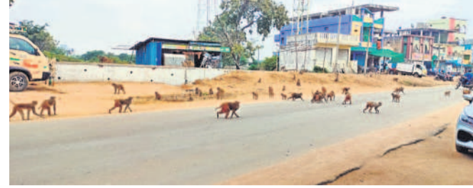
నిజాంపేటలో రోడ్డుకు అడ్డంగా ఉన్న వానర సైన్యం