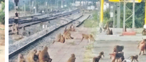
అక్కన్నపేట రైల్వే స్టేషన్లో కోతుల గుంపు

రామాయంపేట, డిసెంబర్ 8: వామ్మో వానర సైన్యం వందలాదిగా వచ్చి రోడ్డుకు అడ్డంగా కూర్చుంటున్న కోతుల దండం. రోడ్డుకు ఇటు, అటు సైడ్లో కూర్చుని ప్రయాణికులు వెళ్లకూడ వాహనాలు కడలకుండా వీరంగం చేస్తున్నారు. రామాయంపేట, నిజాంపేట మండలాల్లోని వివిధ గ్రామాలు, ప్రధాన రహదారులపై కోతులు దాడులు చేస్తున్నారు. రోడ్డుపై కోతులు చేస్తున్న వీరంగాన్ని ప్రజలు చూస్తున్నారని తప్ప ఏమీ