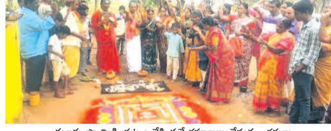
మల్లన్న స్వామికి పట్నం వేసి ప్రత్యేకపూజలు చేస్తున్న భక్తులు