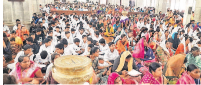
ప్రాధాన్యత పాల్గొన్న భక్తులు

మెడక్ మున్సిపాలిటీ, డిసెంబర్ 8: ప్రపంచ ప్రఖ్యాతిగాంచిన మెడక్ చర్చి ఆవరణలో క్రిస్టన్ సందడి నెలకొన్నది. సీఎస్ఐ వసతి గృహాల్లో పశువుల పాక, బెత్తెనీ, నజరేతు సభ్యులు గంట సంతకం, సువేదన, నోబు రూపొందించారు. ఇవి చూపించు అకర్షణ్య స్థాయి. ఆదివారం దూర ప్రాంతాల నుంచి భక్తులు, పర్యాటకులు పెద్దఎత్తున మెడక్ చర్చికి తరలివచ్చారు. ఉదయం నుంచి మధ్యాహ్నం వరకు జరిగిన ప్రాధాన్యత పాల్గొన్న భక్తులు, పర్యాటకులు పెద్దఎత్తున మెడక్ చర్చికి తరలివచ్చారు. ఉదయం నుంచి మధ్యాహ్నం వరకు జరిగిన ప్రాధాన్యత పాల్గొన్న భక్తులు, పర్యాటకులు పెద్దఎత్తున మెడక్ చర్చికి తరలివచ్చారు. ఉదయం నుంచి మధ్యాహ్నం వరకు జరిగిన ప్రాధాన్యత పాల్గొన్న భక్తులు, పర్యాటకులు పెద్దఎత్తున మెడక్ చర్చికి తరలివచ్చారు.