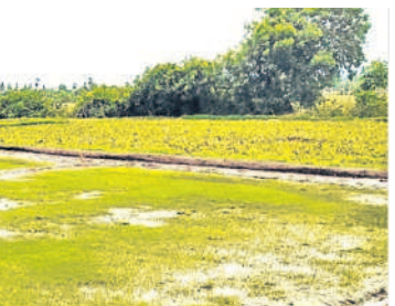
హుస్సాబాద్ పట్టణ శివారులో నారు పోసుకున్న రైతు