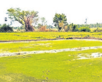
హుస్సాబాద్ పట్టణ శివారులో నారు పోసుకున్న రైతు