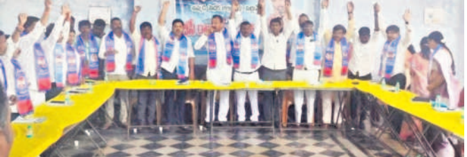
నినాదాల చేస్తున్న తీసే నేతలు