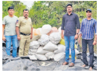
వర్తమాణ్ లో రేషన్ బియ్యం పట్టుకున్న ట్యాంక్ ఫోర్స్ పోలీసులు