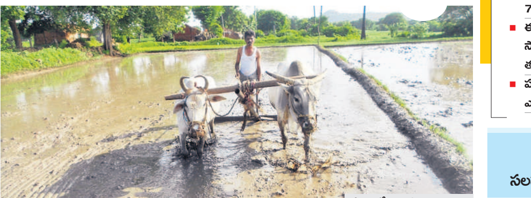
పాలంలో గిల్ల కొడుకున్న రైతు

హుస్సాబాద్, డిసెంబర్ 8 : వానకాల పంట కోతలు పూర్తయ్యాయి. ఇక యాసంగి సాగు రైతులందరూ సన్నద్ధ మవుతున్నారు. హుస్సాబాద్ వ్యవసాయ డివిజన్ పరిధిలోని హుస్సాబాద్, అక్కన్నపేట, కొహడ, బెజ్జంకి మండలాల్లో యాసంగి పంట సాగు రైతులు నారు మడులు దున్ని నార్డు పువ్వులు వేరుచేస్తున్నారు. కొందరు రైతుల నార్డు సైతం ఎదిగి నాలు వేసే ప్రక్రియ చేరుకున్నారు. మొక్కజొన్న వేరుచేసిన, పొద్దుతిరుగుడు పంటలు కూడా వేస్తున్నారు. వానకాలం పంట కోతలు పూర్తి కాగా, మార్కెట్లకు తరలివచ్చిన రైతులు యాసంగి ఎవుసం పనుల్లో నిమగ్నమవుతున్నారు. ఆగస్టు నెల వివరిలో సెప్టెంబర్ ప్రారంభంలో కురిసిన భారీ వర్షాలు యాసంగి పంటల సాగుకు ఎంతో ఉపయోగపడుతున్నాయి. ఇప్పటికే చెరువులు, కుంటల్లో నీళ్లున్నాయి. రైతులు పొలం దున్ని నార్డు వేయడమే తరువాయి.. అయితే ప్రస్తుతం ఉన్న నీళ్లు చూసి ఎక్కువ విస్తీర్ణంలో సాగు చేయడం సరికాదని, రాసురాసు భూగర్భ జలాలు తగ్గి అవకాశం ఉన్నందున రైతులు పంటలను అతితాచి వేసుకోవాలని వ్యవసాయాధికారులు సూచిస్తున్నారు.