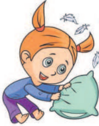
కింది బొమ్మ సరైన నీడ ఏదో కనుకోండి.