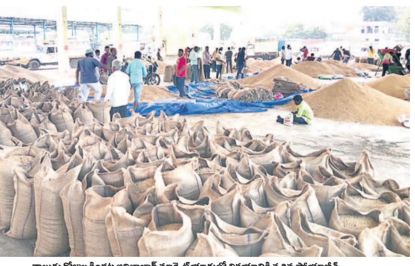
నాలుగు రోజుల కిందట ఆదిలాబాద్ మార్కెట్ యార్డులో విక్రయానికి వచ్చిన సోయాబీన్

ఆదిలాబాద్, డిసెంబర్ 6 ( నమస్తే తెలంగాణ ) : ఆదిలాబాద్ మార్కెట్ యార్డులో సోయాబీన్ పంట కొనుగోళ్లు రెండ్రోజులుగా నిలిచిపోవడంతో రైతులు ఇబ్బంది పడుతున్నారు. జిల్లాలో పలు చోట్ల వర్షం కురుస్తున్నందున పంటలో తేమ శాతం ఎక్కువగా ఉండడంతో పాటు పంటను మార్కెట్కు తీసుకురావడంలో రైతులకు ఇబ్బందిగా మారిందనే కారణంతో సోయాబీన్ కొనుగోళ్లను నిలిపివేసినట్లు మార్కెట్ డిప్యూటీ జిల్లా మేనేజర్ ప్రవీణ్ రెడ్డి తెలిపారు. జిల్లాలో రెండు రోజులుగా కిందట సోయాబీన్ కొనుగోళ్లు ప్రారంభం కాగా ఇప్పటి వరకు 2.50 లక్షల క్వింటాళ్ల పంటను