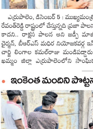
జిల్లా పరిషత్ కార్యక్రమం