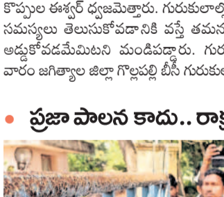
జిల్లా పరిషత్ కార్యక్రమం