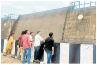
భూకంపాన్ని తట్టుకొని నిలబడ మేడిగడ్డ

తల్లి విగ్రహ ఫోటోను నెటిజన్లు సోషల్ మీడియాలో షేర్ చేస్తూ రేపంతో సర్కారు వైఖరిని ఎండగడుతున్నారు. తెలంగాణ ఆడవిడ్డలంకే ఇంత విన్నవారా? నగలు, కిరీటాలు ఉండొచ్చా? అంటూ నిలదీస్తున్నారు. 'తెలంగాణ తల్లి రూపాన్ని మార్చాలి... సంస్కృతి, సంప్రదాయాలు కనిపించేలా, ప్రజల మనసులో ఉన్న రూపాన్ని తీసుకొస్తాం. ఇందుకు రాష్ట్రంలోని అన్ని వర్గాల అభిప్రాయాలు తీసుకుని, ప్రజల అభిప్రాయం మేరకు మార్పులు చేస్తాం' అంటూ డిసెంబర్ 4న మంత్రివర్గ సమావేశ తర్వాత ప్రభుత్వం ప్రకటించింది. సంప్రదింపుల కోసం డిప్యూటీ సీఎం భట్టివారి క్రమార్థం నేతృత్వంలోని క్యాబినెట్ సభకే మిటి ఏర్పాటు చేసింది. కానీ సభ కమిటీ ఎవరిని సంప్రదించింది, విగ్రహాన్ని గుర్తుబొమ్మగా దాచాలిని ఆవనోదానం తెలంగాణ వాదులు ప్రశ్నిస్తున్నారు.