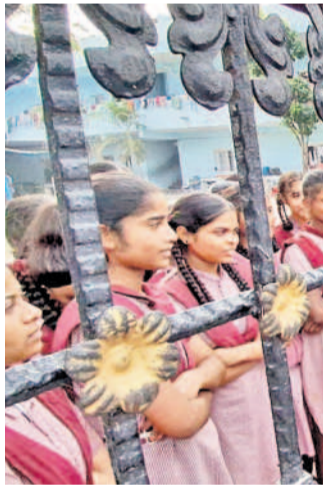
జిల్లా పరిషత్ కార్యక్రమం