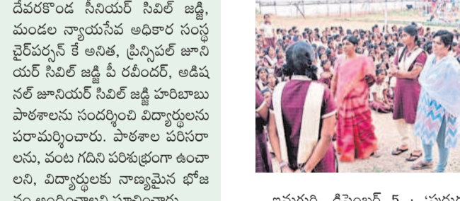
జిల్లా పరిషత్ కార్యక్రమం