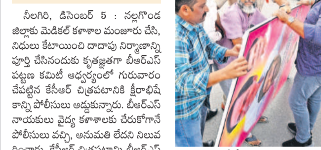
నల్లగొండలో జిల్లా పరిషత్ కార్యక్రమం