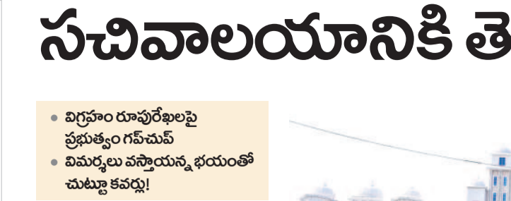
సచివాలయానికి చేరుకున్న తెలంగాణ తల్లి విగ్రహం కనిపించకుండా చుట్టూ కవచ్చి

తున్నాయి. గతంలో బీఆర్ఎస్ రూపొందించిన తెలంగాణ తల్లి విగ్రహంపై విమర్శలు చేసిన కాంగ్రెస్.. ఇప్పుడు ఎవరిని సంప్రదిం