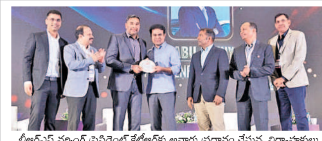
బీఆర్ఎస్ వర్కింగ్ ప్రెసిడెంట్ కేబీఆర్ కు అపార్థ ప్రధానం చేస్తున్న నిర్వాహకులు