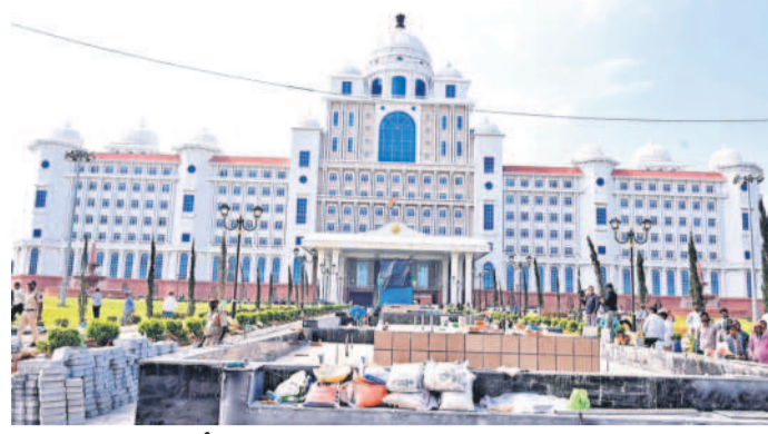
సచివాలయానికి చేరుకున్న తెలంగాణ తల్లి విగ్రహం కనిపించకుండా చుట్టూ కవచ్చి

తున్నాయి. గతంలో బీఆర్ఎస్ రూపొందించిన తెలంగాణ తల్లి విగ్రహంపై విమర్శలు చేసిన కాంగ్రెస్.. ఇప్పుడు ఎవరిని సంప్రదిం