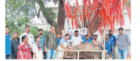
పశువులకు వైద్య చికిత్స అందిస్తున్న అధికారులు