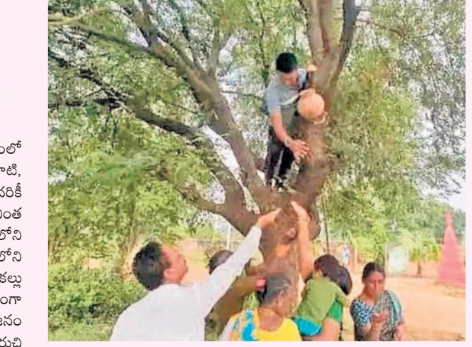
చింత వెట్లకు వస్తున్న కల్లును చూసేందుకు వస్తున్న ప్రజలు

కొత్తగూడ, డిసెంబర్ 4: మండలంలో విచిత్ర ఘటన చోటుచేసుకుంది. తాటి, ఈత, వేప వెట్లకు కల్లు రావడం అందరికీ తెలిసిన విషయమే. కానీ, భిన్నంగా ఓ వింత వెట్లకు కల్లు పారుతోంది. కొత్తగూడంలోని వేలుబెల్లి పంచాయతీ సమీపంలోని పోచమ్మగుడి దగ్గరన్న చింత వెట్లకు కల్లు పారుతోంది. ఈ వార్త సంచలనంగా మారింది. విషయం తెలుసుకున్న జనం చూసేందుకు తరలివస్తున్నారు. కల్లు రుచి చూసి, బాగుందని అంటున్నారు. కొత్తగూడ, డిసెంబర్ 4: మండలంలో విచిత్ర ఘటన చోటుచేసుకుంది. తాటి, ఈత, వేప వెట్లకు కల్లు రావడం అందరికీ తెలిసిన విషయమే. కానీ, భిన్నంగా ఓ వింత వెట్లకు కల్లు పారుతోంది. కొత్తగూడంలోని వేలుబెల్లి పంచాయతీ సమీపంలోని పోచమ్మగుడి దగ్గరన్న చింత వెట్లకు కల్లు పారుతోంది. ఈ వార్త సంచలనంగా మారింది. విషయం తెలుసుకున్న జనం చూసేందుకు తరలివస్తున్నారు. కల్లు రుచి చూసి, బాగుందని అంటున్నారు.