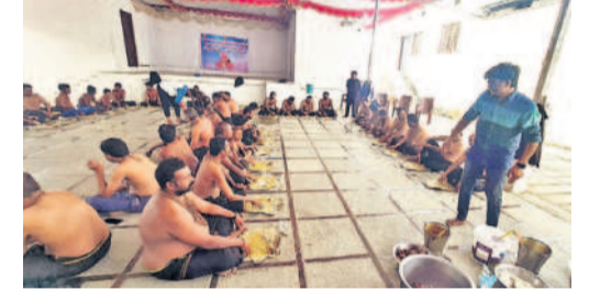
భిక్ష చేస్తున్న అయ్యప్ప, వీరభద్రస్వాములు