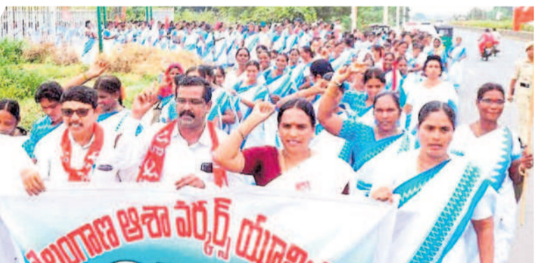
ధర్మా చౌక్ నుంచి ఖమ్మం కలెక్టరేట్ వరకు యాత్రా నిర్వహిస్తున్న ఆశ వర్కర్లు