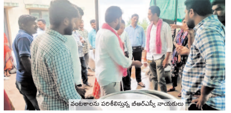
వంటశాలను పరిశీలిస్తున్న బీఆర్ఎస్ నాయకులు