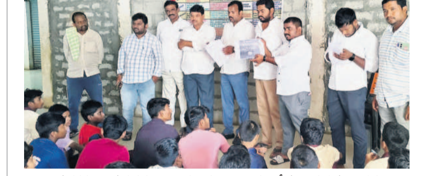
దామరపల్లె గిరిజన గురుకుల బాలర పాఠశాల విద్యార్థులతో మాట్లాడుతున్న నాయకులు