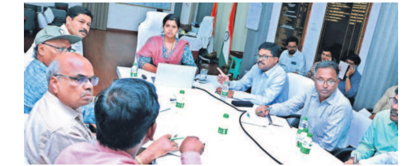
సమావేశంలో మాట్లాడుతున్న కలెక్టర్ ఇలా త్రిపాఠ

ముసుగోడు, డిసెంబర్ 3 : ఆరు గాలం కప్పడే వంట పండించిన రైతులు సీసీబి తీరుతో ఆదోక్షన చెందుతున్నారు. ముసుగోడు మండలం కొంపెల్లి గ్రామంలో గల జేటీ పత్తి మిల్లు యాజమాన్యం తేమ సాకుతో ఒక్కొక్క ట్రాక్టర్ కు సుమారు రూ.80వేలను 200 కోట్ల వరకు తరగు తీస్తున్నారు. ఇదేంటని ప్రశ్నిస్తే పత్తిని కొనుగోలు చేయకపోతే తిరిగి పంపిణీ చేస్తారు. ఈ క్రమంలో రైతుల మంగళవారం మిల్లు వద్ద ధర్మా నిర్వహించారు. విషయం తెలుసుకున్న పోలీసులు, వ్యవసాయ అధికారులు అక్కడికి వచ్చి ధర్మాను విరమించేశారు. ఈ సందర్భంగా పలువురు రైతులకు మూట్లూడుతూ కేంద్ర ప్రభుత్వం 8శాతం తేమ ఉన్న ఏ గ్రేడ్ పత్తి క్లింబాలకు రూ.7,521 ధర నిర్ణయించినట్లుగా, 9నవంబర్ 12శాతం వరకు తేమ ఉంటే ఒక్కొక్క శాతానికి రూ.75 తక్కువగా కొనుగోలు చేయాలని నిర్ణయించినది చెప్పారు. కుందూ తిరిగి పంపిణీ చేస్తారు. ఈ క్రమంలో రైతుల మంగళవారం మిల్లు వద్ద ధర్మా నిర్వహించారు.