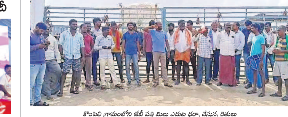
కొంపెల్లి గ్రామంలోని జేటీ పత్తి మిల్లు ఎదుట ధర్మా చేస్తున్న రైతులు

- పెట్ల చిన్న సైదులు, జానపహాడ్, పాలకూడు మండలం