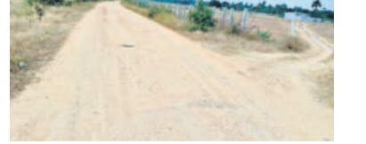
చోల్లెరు - జమ్మూపూరు రోడ్డు