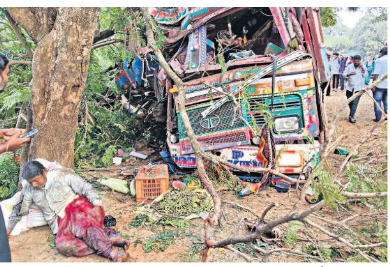
రంగారెడ్డి జిల్లా చేవెళ్ల మండలం అలూర్ గేట్ వద్ద సోమవారం సాయంత్రం రోడ్డు పక్కన కూరగాయలు అమ్మకుంటున్న చిరువ్యాపారులపైకి వేగంగా దూసుకొచ్చిన లారీ