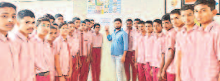
పబ్లికాబాద్ టౌన్, గోడకు అంబించిన హెల్త్ ట్రైన్ నందెరు చూపుతున్న బీఆర్ఎస్ నాయకుడు