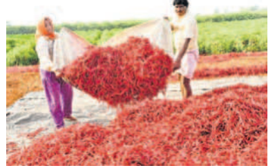
రైతులు ఉన్నారు. ప్రభుత్వరంగా చే యాతనిచ్చి ఆదుకోవాలని కోరు తూము.

జిల్లాలో మిర్చి సాగు ఇలా.. జోగుళాంబ గద్వాల జిల్లాలోని భూములు మిర్చి సాగుకు అనుకూలంగా ఉండడంతో రైతులు ఈ పంటకు ఆసక్తి చూపుతారు. అలం పుల్లి, గద్వాల నియోజకవర్గాల్లోని మల్లకల్ ప్రాంతంలో ఎక్కువగా పంట సాగు చేస్తారు. ఏడాదికి ఏడాది ఏడాది సాగు జిల్లాలో పెరుగుతున్న రైతులకు మాత్రం అనుకూల స్థాయిలో లాభాలు రావడం లేదు. 2020లో 24,388, 2021లో 35,085, 2022లో 38,757 ఎకరాల్లో మిర్చి సాగు చేయగా.. మంచి లాభాలు వచ్చాయి. దీంతో 2023లో 65,115, 2024లో 75,842 ఎకరాల్లో పంట సాగింది. అయితే రైతులు ఎక్కువగా సాగు చేయడంతో తెగులు సోకడం, అనుకూల స్థాయిలో ధరలు లేకపోవడం, దిగుబడి తగ్గడంతో పెట్టుబడి వచ్చే చాలు అనే ఆందోళనలో