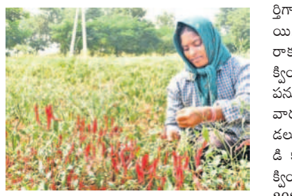
రూ.50 వేలపైనే ఆదాయం వచ్చేది. ప్రస్తుతం రైతు పండిం చేసి మిర్చిని అమ్మిన పైపై పెట్టుబడికి సరిపోయే పరిస్థితి కనిపించడం లేదని రైతులు వాపో తూము. ప్రస్తుతం రైతులు సాగు చేసిన మిర్చి పంటకు ఆకు ముడత పురుగు, కొమ్ముళ్లు, జెమిని వైరస్, పచ్చ తెల్ల డిమ్మ సోకడంతో పై ఎడకపోవడంతో పంట దిగుబడి రాకపోవడంతో రైతులు ఆందోళన చెందుతున్నారు.

గతేడాది మిర్చి సాగు చేసిన రైతులు పంటకు ఆకు ముడత తెగులు సోకడంతో నష్టపోయారు. ఈ ఏడాదిని లాభాలు రావాలని గంపె దాశతో రైతులు ఈ వాన కాలం గద్వాల, అలం పుల్లి నియోజకవర్గాల్లో జిల్లాలో పెద్ద అత్తున మిరప పంట సాగు చేశారు. అయితే ప్రస్తుతం మిర్చి సాగు చేసిన రైతుల కంట్లో కన్నీటి చుక్కలు కారుతున్నాయి. కాలం కలిసి రాకపోవడంతో ఏమి చేయాలో తోచడం లేదు. వేసిన పంటకు తెగుళ్ల పీడ ఉండడంతో రైతుకు ఈ పరిణామం కంటి మీద కుసుకు లేకుండా చేసింది. పంటను నమ్మకుని లాభాలు వస్తాయని అనుకున్న మిర్చి రైతులకు అప్పులు మిగిలాలని పేర్లు వచ్చాయి. నడిగడ్డ భూములు మిర్చి సాగుకు అనుకూలం కావడంతో రైతులు 2024లో ఈ పంటను పెద్ద మొత్తంలో సాగు చేశారు. సాగు చేసిన రైతులకు పెట్టుబడి పోను ఏటా ఎకరాకూర్కా