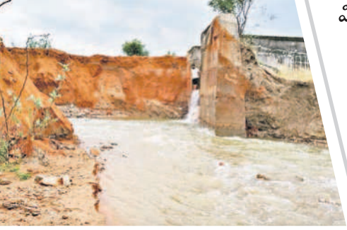
వెల్లంపల్లి వద్ద కేవలం కాల్వలు గండిపడి వ్యధాగా పోతున్న నీళ్లు