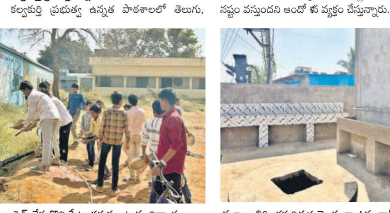
పైద వేసుకొని ప్లేట్ల కడుక్కుంటున్న విద్యార్థులు

కల్వకుర్తి, డిసెంబర్ 1 : మాగూర్ పుటల కళ ముందు కడరా డక్కు ప్రభుత్వ యంత్రాంగంలో చలన లేదనే విషయం బాహుబంగా వినిపిస్తున్నాయి. ఆరు కుటుంబం, నాసిరకం బియ్యం, వంటసామగ్రి, కలెక్షన్ మన వినియోగం కడక కారణాలతో పాఠశాలలో వందతున్న మధ్యాహ్న భోజనంలో విద్యార్థులు ఇబ్బందులు ఎదుర్కొంటున్నారు. కేసీఆర్ ప్రభుత్వం మధ్యాహ్న భోజనంలో విద్యార్థులకు ఇబ్బందులు కలుగ నీయట్టనే ఎప్పటికప్పుడు పంట ఏజెన్సీలకు బిల్లులు చెల్లిస్తూ, సన్న బియ్యాన్ని సరఫరా చేసింది. మన ఊరు-మన బడి పథకం కింద పంట గదులు, మిషన్ భగీరథ స్వచ్ఛమైన నీరు, విద్యార్థులు కూర్చోని తీసేందుకు వీలుగా డిసెంబర్ హాల్ లను నిర్మించేందుకు నిధులు కేటాయించి పనులు ప్రారంభించింది. రాష్ట్రంలో కాంగ్రెస్ ప్రభుత్వం అధికారంలోకి వచ్చాక మన ఊరు-మన బడి పథకం అటకెక్కింది. నిధుల లేమితో డైనింగ్, వంట గదుల నిర్మాణం, మిషన్ భగీరథ ట్యాంకుల నిర్మాణాలు ఆర్థికంగా గా నిలిచిపోయాయి వంట ఏజెన్సీలకు సకాలంలో బిల్లులు రాక అరిగోన పడుతున్నాయి. పేద, బడగు, బల డీసెన్ వర్గాల చదువకుంట్ల పాఠశాల విద్యార్థులకు మధ్యాహ్న భోజనం కడుపునింప తో పోవడం.. కల్వకుర్తి ప్రభుత్వ ఉన్నత పాఠశాలలో తెలుగు, ఇంగ్లీష్, ఉర్దూ మీడియంలో దాదాపు 500మంది విద్యార్థులు విద్యనభ్యసించుతున్నారు. ఇందులో చాలామంది విద్యార్థులు బీసీ, ఎస్సీ వసతిగృహాల్లో చదువుకుంటున్న వారితోపాటు, మట్టుపక్కల గ్రామాలకు చెందిన వారు విద్యనభ్యసించుతున్నారు. వీరు మధ్యాహ్న భోజనం పాఠశాలలోనే చేస్తున్నారు.