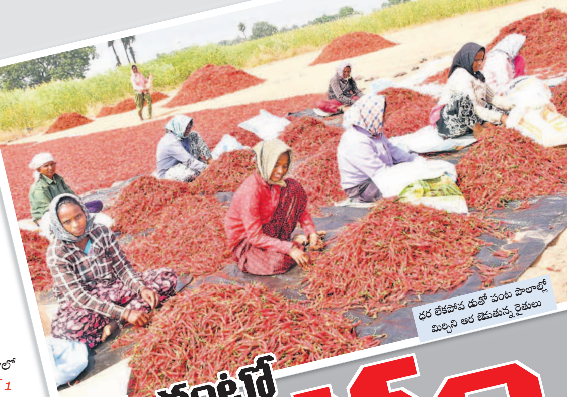
ధర లేకపోవడంతో పంట పొలాల్లో మిర్చిని ఆర చేసుకున్న రైతులు

పెట్టుబడి వచ్చేలా లేదు.. మాడెకాలు కొలు కు తీసుకొని మిరప సాగు చేశాను. పంటకు తెగులు సోకడంతో దిగుబడి పెరగడం లేదు. గతంలో ధరలు బాగా ఉండగా.. ఈ ఏడాది దిగుబడి తక్కువే.. ధరలు లేవు. కూలీ ఒకరికి రోజుకు రూ.400 వందల చెల్లిస్తున్నాం. ఎక రాకు పెట్టుబడి రూ. లక్ష వరకు పెట్టాం. ధర లేకపోవడం.. కూలీ పెరగడంతో మిరప కోకకో యేకుండా చెట్లపైనే వదిలేశా. ప్రభుత్వ పరంగా ఆదుకుంటే తప్పా రైతులు ఈ కష్టం నుంచి బయటపడే అవకాశం లేదు. - ఆం. రైతు, మిడియాస్టి