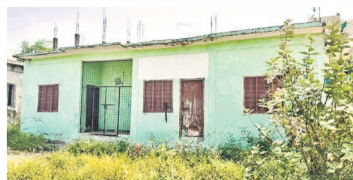
సంగారెడ్డి జిల్లా బొల్లారంలో నిరుపయోగంగా ఈఎన్ఐ డిస్సిస్సరీ భవనం

పరిశ్రమలు ఒకచోట, డిస్సిస్సరీ మరోచోట.. మార్గాలని విజ్ఞప్తి చేసినా మారని వైద్యం