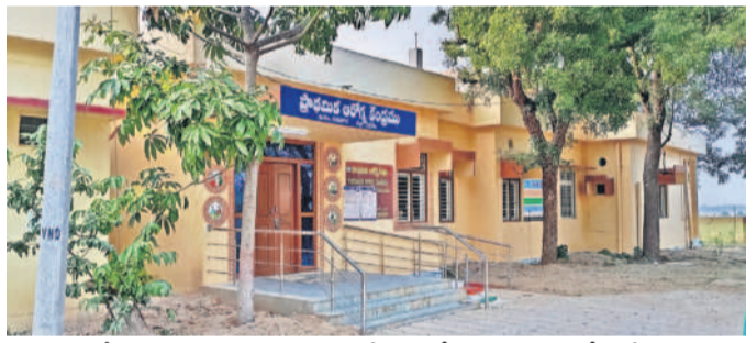
సిద్దిపేట జిల్లా రాయపాల్ మండల కేంద్రంలోని ప్రాథమిక ఆరోగ్య కేంద్రం

సిద్దిపేట జిల్లా రాయపాల్ మండలంలో పరిస్థితి