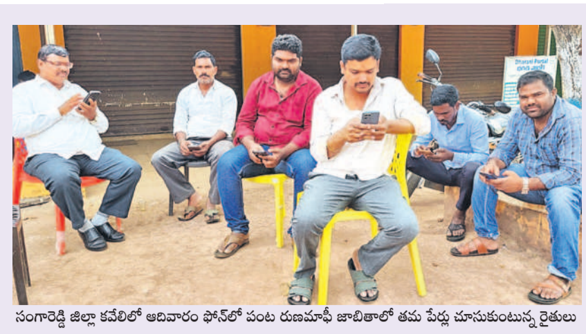
సంగారెడ్డి జిల్లా కవేలిలో ఆదివారం ఫోన్లో పంట రుణమాఫీ జాబితాలో తమ పేర్లు చూసుకుంటున్న రైతులు