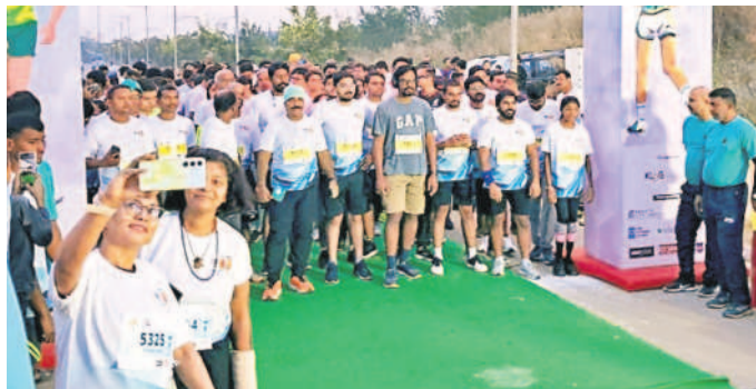
కంది ఐబిహెచ్లో నిర్వహించిన హాఫ్ మారథాన్ పాల్గొన్న పోటీదారులు