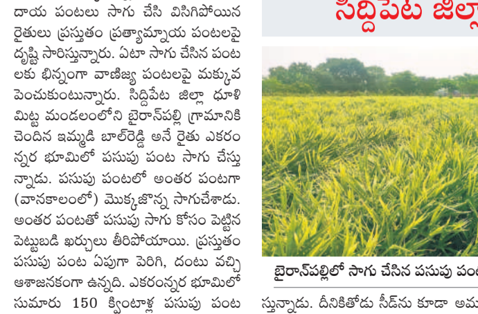
బైరాన్ పల్లిలో సాగు చేసిన పసుపు పంట

సిద్దిపేట జిల్లా బైరాన్ పల్లికి పసుపు పంట పరిచయం