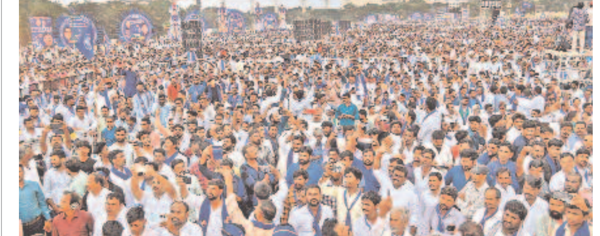
అదివారం సికింద్రాబాద్ లోని పరేడ్ గ్రౌండ్ లో నిర్వహించిన సింహగర్జన సభకు రాష్ట్రం నలుమూలల నుంచి మాలలు పెద్దఎత్తున తరలివచ్చారు. పాల్గొన్న అతిథులు నాయకులు, ఎమ్మెల్యేలు, ఎంపీలు హాజరయ్యారు. కులవివక్షపై నువ్వీకోర్టు ఇచ్చిన తీర్పు ఎన్నోలను విభజించేలా ఉన్నదని పేర్కొన్నారు. ఆ తీర్పుతో లిజిస్లేషన్ రద్దయ్యే ప్రమాదముందని వారు ఆందోళన వ్యక్తంచేశారు. తమ పోరాటాన్ని డిబ్బీ వరకు తీసుకెళ్లమని ప్రకటించారు. >7