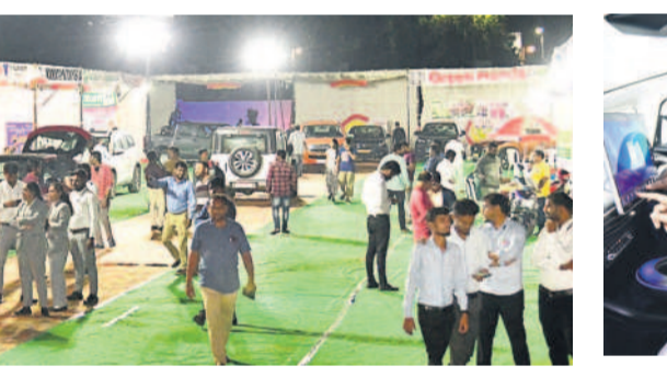
ముహూర్తా జ్యోతిషా పూలే(సర్వస్వ) మైదానంలో ఆటో షోకు తరలివచ్చిన బెల్గామీకులు