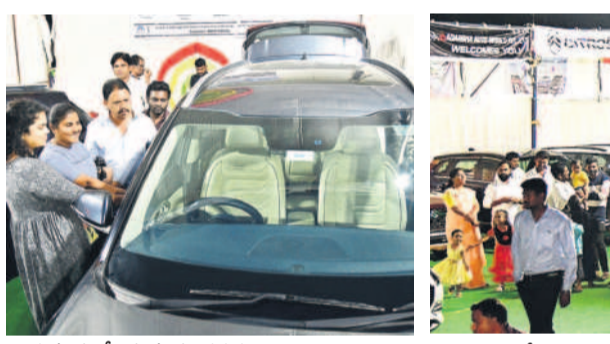
కారును పరిశీలిస్తున్న సందర్భములు