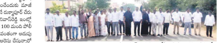
ముల్లపూర్లో రాస్యారోలో మల్లపూర్ గురుకులంలోకి అనుమతించకపోవడంతో రాస్యారోలో చేస్తున్న బీఆర్ఎస్ నాయకులు

తమ తప్పులు బయటపడతాయనే భయంతోనే రాష్ట్ర ప్రభుత్వం ప్రతిపక్షాలు, ప్రజల నోళ్లు నొక్కుతున్నదని మాజీ ఎమ్మెల్యే, బీఆర్ఎస్ సీనియర్ నాయకుడు నారదాసు అభిప్రాయం వ్యక్తం చేశారు. బీఆర్ఎస్ గురుకులాల బాటను ఉద్దేశపూర్వకంగా అడ్డుకొని, కొప్పల ఈశ్వర్, సుంకె రవి శంకర్లను అక్రమంగా అరెస్ట్ చేశారని ధ్వజమెత్తారు. వారిని నిర్బంధించడం ప్రభుత్వ పీఠికీ చర్యగా ఆయన అభిప్రాయం వ్యక్తం చేశారు. ప్రజాస్వామ్యంలో ప్రశ్నించే హక్కు ప్రతిపక్షాలకు ఉంటుందని, ఆ హక్కును కాంగ్రెస్ ప్రభుత్వం కాలరాస్తున్నదని మండిపడ్డారు. కాంగ్రెస్ ప్రభుత్వం చేస్తున్న కట్టుబాటు పాలనలో అన్ని వర్గాల ప్రజలు ఇబ్బందులు పడుతున్నారని తెలిపారు. ఇప్పటికైనా ప్రభుత్వం తన వైఖరిని మార్చుకుని ప్రతిపక్షాలు, ప్రజలు చేస్తున్న సూచనలు పాలించాలని హితవుపలికారు.