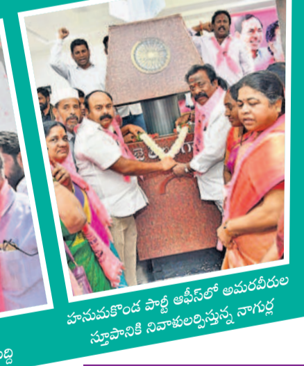
హనుమకొండ పాతి ఆవీర్ అమరశ్రీల సూర్యనాటి నివాళులర్పిస్తున్న నాగర్