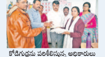
కోడిగుడ్డును పరిశీలిస్తున్న అధికారులు

హుస్సేనాబాద్ రూరల్, నవంబర్ 29: మండలంలోని ఫోతారం (ఎస్)లోని మహాత్మా జ్యోతిబాపూలే గురుకుల పాఠశాలలో శుభ్రవారం సైబల్ టాన్స్ ఫోర్స్ బృందం తనిఖీ నిర్వహించింది. ఈ సందర్భంగా వారు హాస్టల్ లో విద్యార్థులకు అందిస్తున్న మధ్యాహ్న భోజనం, హాస్టల్ లోని పంట సామగ్రి, స్టాఫ్ రూమ్ లో ఉన్న కోడిగుడ్డు, పప్పులు, కూరగాయలను పరిశీలించారు. వంట గది, హాస్టల్ పరిసర ప్రాంతాలు, టాయిలెట్స్ ను తనిఖీ చేశారు. అనంతరం విద్యార్థులతో కలిసి మధ్యాహ్న భోజనం చేశారు. హాస్టల్ లో ఉన్న రోపాల్ ను పరిశీలించి ప్రాంతాలు, టాయిలెట్స్ ను తనిఖీ చేశారు. అనంతరం విద్యార్థులతో కలిసి మధ్యాహ్న భోజనం చేశారు.