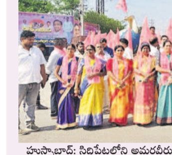
హుస్సేనాబాద్: నిధిపేటలోని అమరవీరుల స్మారక చిహ్న వివాళులర్పిస్తున్న టిఆర్ఎస్ హుస్సేనాబాద్ నాయకులు