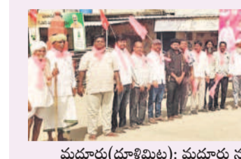
మద్యూక్ (హుశిమిట్ల): మద్యూక్ నుంచి దీక్షా దివసకు వెళ్లిన టిఆర్ఎస్ నేతలు