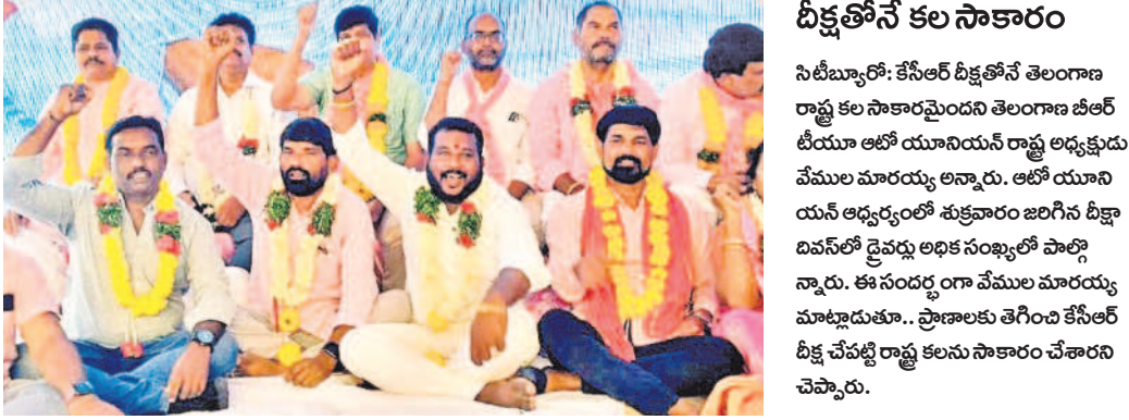
దీక్షతోనే కల సాకారం

కేసీఆర్ దీక్షతోనే దిగివచ్చిన కేంద్రం ఎమ్మెల్యే సుధీరెడ్డి బీఆర్ఎస్ అధినేత కేసీఆర్ ఆధ్వర్యంలో తెలంగాణ రాష్ట్రం ఏర్పాటు కోసం అనేక రకాలుగా చెబుతున్నా.. కేంద్ర ప్రభుత్వం స్పందించకపోవడంతో విద్యార్థులు ఆత్మబలిదానాలు చేసుకున్నారు. ఈ క్రమంలో కేసీఆర్ చేపట్టిన ఆమరణ నిరాహార దీక్షతో కేంద్ర ప్రభుత్వం దిగివచ్చింది. 2014 జూన్ 2 న తెలంగాణ రాష్ట్రాన్ని ఏర్పాటు చేస్తూ, గెజిట్ విడుదల చేసింది.