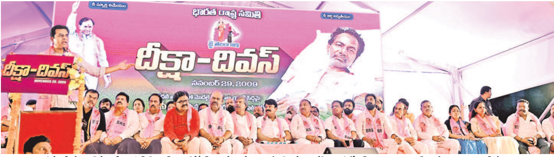
తెలంగాణ భవన్ లో జరిగిన దీక్షా దినంలో ప్రసంగిస్తున్న బీఆర్ఎస్ వర్కింగ్ ప్రెసిడెంట్ కే.జి.ఆర్., చిత్రంలో ఎమ్మెల్యేలు మురాగోపాల్, కాలేరు వెంకటేశ్, మాగంటి గోపీనాథ్, తలసాని, పద్మావతిగౌడ్, ఎమ్మెల్యేలు కణక, మహామూర్తి లలి, మధుసూదన చారి