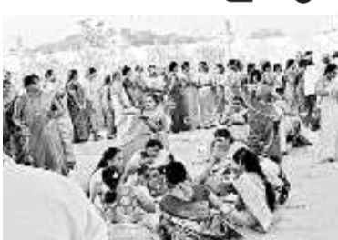
రాగినేడు స్వయంభూ శివాలయంలో భోజనం చేస్తున్న వైశ్యులు

పెద్దపల్లి రూరల్, నవంబర్ 29: రాగినేడులోని స్వయంభూ శివాలయం వద్ద నాగలింగేశ్వరస్వామి ఆలయ ఆవరణలో శుభ్ర వారం పరిసర ప్రాంత వైశ్యులంతా వనభోజనాల కార్యక్రమం ఏర్పాటు చేసు