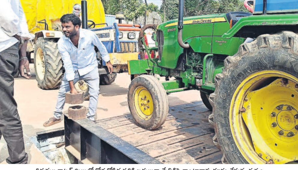
తిరుమల కాటన్ మిల్లులో కోత కోసిన పత్తి బదులుగా వేల్చివేసి కాంటాకాళ్లు తూకం వేస్తున్న దృశ్యం

మిల్లుల పద్ధతు తీసుకొచ్చిన పత్తి ట్రాక్టర్లకు ముందుగా బోకెస్సు జారీ చేసి తేమ శాతం చూస్తున్నారు. తేమ 8 శాతం వస్తే క్వంటాల్కు రూ. 7,500, 12 శాతం వస్తే రూ. 7,200 మద్దతు ధర ప్రకటించారు. కానీ ట్రాక్టర్ మిల్లులోకి వెళ్లిన తర్వాత పత్తిలో కాంయలు ఉన్నాయని, నాణ్యత లేని పత్తి ఉందనే సాకుతో ట్రాక్టర్లకు రెండు నుంచి మూడు క్వంటాళ్ల పత్తి కోత కోస్తున్నారు. దీంతో రైతు రూ.20 వేల వరకు నష్టపోతున్నారు. కోత అంగీకరించని రైతులను దిగుమతి అయిన పత్తిని తీసుకుని ప్రైవేటులో అమ్ముకోవడం చెప్పన్నారు. దిగుమతి అయిన ట్రాక్టర్ కోతకు గురైన పత్తి బదులు బండి కాంటా వేసేటప్పుడు మనసులు నిలుబడటం లేదా వేల్చివేసి తూకం రాళ్లు వేసి కోత కోయడం చేస్తున్నారు. ప్రశ్నించిన