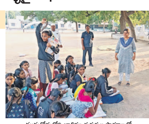
మునుగోడులోని బాలికల గురుకుల పాఠశాలలో విద్యార్థులతో మాట్లాడుతున్న కలెక్టర్ ఇలా త్రిపాతి

మునుగోడు, నవంబర్ 27 : మండల కేంద్రంలోని మహాత్మా జ్యోతిబా పూలే బాలికల గురుకుల పాఠశాలను బుధవారం కలెక్టర్ ఇలా త్రిపాతి ఆకస్మికంగా తనిఖీ చేశారు. పాఠశాలలోని 9వ తరగతి విద్యార్థినిలకు గణితం టీచర్ గా మారి బోధించారు. పాఠశాలలోని మౌలిక వసతుల గురించి విద్యార్థినిలను అడిగి తెలుసుకున్నారు. అనంతరం పాఠశాలలో పంట గడులను పరిశీలించారు. పంట గడితోపాటు పరిసరాలు పరిశుభ్రంగా లేకపోవడంతో ఆగ్రహించి కలెక్టర్ పాఠశాల ప్రిన్సిపాల్కు పోకాజ్ నోటీసు జారీ చేయాలని సంబంధిత అధికారులను ఆదేశించారు. పంట గడి, పరిసరాలను ఎప్పటికప్పుడు శుభ్రంగా ఉంచాలని ప్రిన్సిపాల్ను ఆదేశించారు. విద్యార్థులకు నాణ్యమైన భోజనం అందించాలన్నారు. అంతకుముందు మండల చరిత్రలోని జమ స్టాన్సెల్లో పల్లె ప్రకృతి వనాన్ని సందర్శించి వస