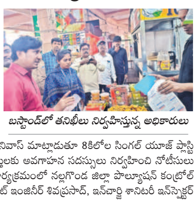
బస్టాండ్లో తనిఖీలు నిర్వహిస్తున్న అధికారులు