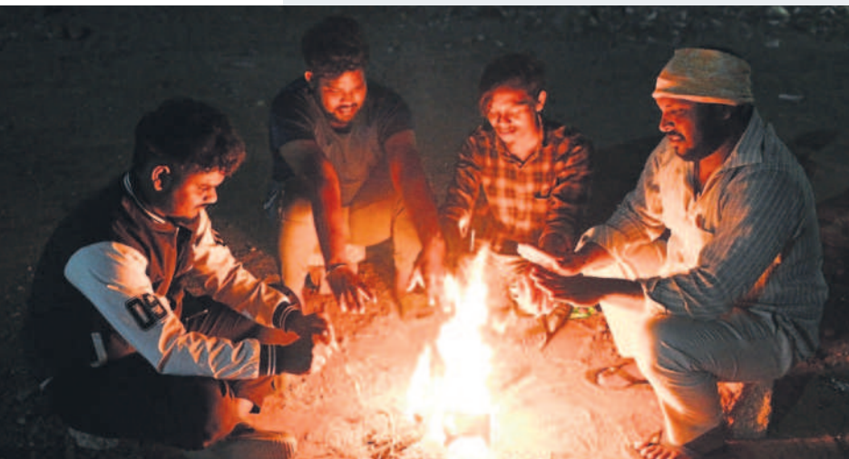
నల్లగొండలో చలి మంట వేసుకున్న యువకులు

జిల్లాలో గడిచిన వారం ముందు వాతావరణం కాస్త సరిగ్గానే ఉన్నప్పటికీ ఆ తర్వాత చోటుచేసుకున్న మార్పుల కారణంగా చలి ప్రభావం పెరిగింది. గరిష్ట ఉష్ణోగ్రతలు 27 డిగ్రీల లోపే నమోదు అవుతుండగా కనిష్ట ఉష్ణోగ్రతలు 17 డిగ్రీల వరకు పడిపోయాయి. దాంతో పొద్దుగూతే సరికి చలి ప్రభావం కనిపిస్తుంది. చలి కారణంగా ప్రధానంగా విద్యార్థులు స్కూల్కు వెళ్లేటప్పుడు ఇబ్బందులు పడుతుండగా, వృద్ధులు బయటకు వెళ్లాలంటేనే జంకుతున్నారు. ఇక దినసరి కూలిలు, రైతులు, చిరువ్యాపారులు తప్పని పరిస్థితుల్లో జాగ్రత్తలు తీసుకుంటూ పనులకు వెళ్తున్నారు.