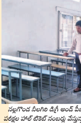
నల్లగొండ సీలగిరి డిగ్రీ అండ్ పీజీ కళాశాలలో పరీక్షల హాల్ టీకెట్ సంబంధ వేస్తున్న అధ్యాపకుడు

రామగిరి, నవంబర్ 27 : మహాత్మాగాంధీ యూనివర్సిటీ పరిధిలో ఉమ్మడి జిల్లా వ్యాప్తంగా డిగ్రీ విద్యార్థులకు నిర్వహించాల్సిన పలు సెమిస్టర్ పరీక్షలు ఈ నెల 28నుంచి ప్రారంభం కానున్నాయి. షీజి రియంబర్స్ మెంట్స్ విడుదల చేయాలని ప్రైవేట్ డిగ్రీ అండ్ పీజీ కళాశాలల యాజమాన్యాలు కళాశాల నిరవధిక బండ్ పాటించడంతో యూనివర్సిటీ పలు పరీక్షలను వాయిదా వేసిన విషయం విదితమే. ప్రభుత్వం యాజమాన్యాలు తో చర్చలు చేయడంతో విద్యార్థుల భవిష్యత్తు దృష్టిలో ఉంచుకుని పరీక్షల నిర్వహణకు ముందుకు వచ్చాయి. దాంతో పర్సనల్ పరీక్షల విభాగం ఆధ్వర్యంలో పరీక్షలకు సిద్ధం చేశారు. నవంబర్లో జరుగాల్సిన పలు పరీక్షలను వాయిదా వేసి డిసెంబర్లో నిర్వహిస్తున్నట్లు ఇప్పటికే యూనివర్సిటీ పరీక్ష విభాగం వెల్లడించింది. 1వ సెమిస్టర్ పరీక్షలు మధ్యాహ్నం 2 నుంచి సాయంత్రం 5 గంటల వరకు, 3వ సెమిస్టర్ పరీక్షలు ఉదయం 10 నుంచి మధ్యాహ్నం 1 గంటల వరకు, 5వ సెమిస్టర్ మధ్యాహ్నం 2 నుంచి సాయంత్రం 5 గంటల వరకు జరుగుతున్నాయి. మారిన పరీక్షల కాలనిర్ణయం పట్టికను పర్సనల్ వెబ్సైట్లో