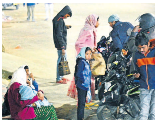
బుధవారం సాయంత్రం నల్లగొండలో స్వేచ్ఛ వేసుకోని కనిపిస్తున్న జనం