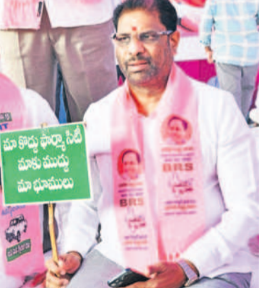
ప్రకారంలో నిరసన తెలుపుతున్న రాజ్యసభ సభ్యుడు వర్షాధికార వరసం