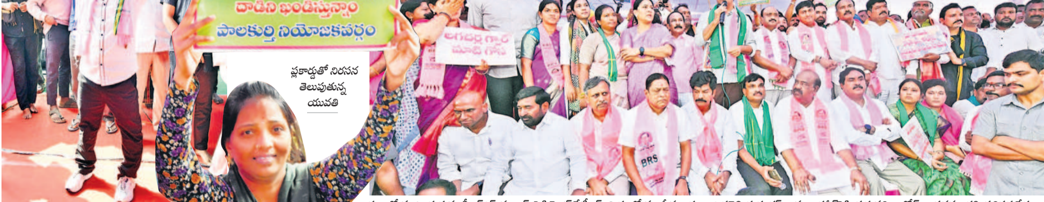
ప్రకారంలో నిరసన తెలుపుతున్న యువతి