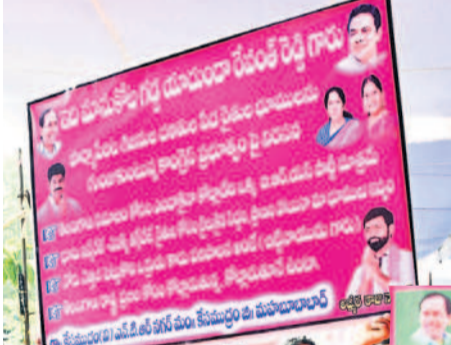
'ఇది మానుకోట గడ్డ యాదికండా.. రేవంత్ రెడ్డి' అనే ప్లేకేసిని ప్రదర్శిస్తున్న యువకుడు