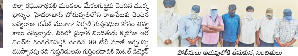
పోలీసులు అదుపులోకి తెచ్చిన నిందితులు