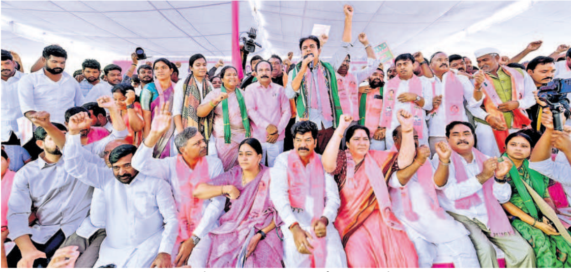
మానుకోట మహాధర్మాల్లో మాట్లాడుతున్న బీఆర్ఎస్ వర్కర్ గౌరవ సెంటర్ కేటీఆర్ చిత్రంలో బీఆర్ఎస్ నాయకులు, ప్రజాప్రతినిధులు