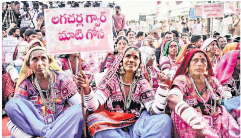
మహా ధర్మాకు భారీ సంఖ్యలో హాజరైన గిరిజనలు, రైతులు, కార్యకర్తలు