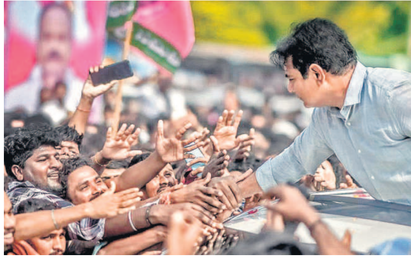
అభిమానులకు కరదాలనం చేస్తున్న కేటీఆర్