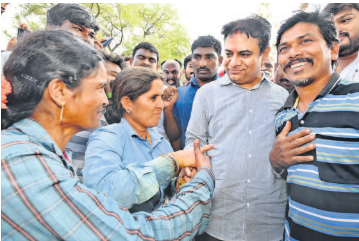
కేటీఆర్ ను ఆత్యయంగా వలకలిస్తున్న గిరిజన మహిళ