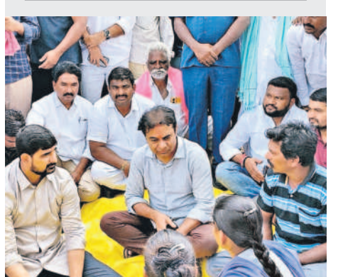
మహాబాబాబాద్ జిల్లా మహాబాబాద్ మండలం బలరాంతుండా రైతులతో ముద్దబిచ్చు కేటీఆర్