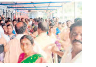
కాశ్యోరంలో స్వామి వారి దర్శనానికి బారులు తీసిన భక్తులు

గణపూర్, నవంబర్ 24 : మోగా వెళ్తున్న కారు అదుపుతప్పి రోడ్డు పక్కన విద్యుత్ స్తంభానికి డిజిగ్ లోల్లొపడిన ఫుటన్ మండలంలోని గాంధీనగర్లో ఆదివారం చోటా చేసినట్లుగా ప్రమాదం కడసం ప్రశారం... మహారాష్ట్రలోని అంకిపాకు చెందిన ఒక కుటుంబానికి చెందిన సుమారు వరంగల్ నుంచి మండల కేంద్రానికి కారులో బయలుదేరారు. ఈ క్రమంలో మండల పరిషత్లోని గాంధీనగర్ చివర రోడ్డుపై ఏర్పడ్డ గుంతలను గమనించక పోవడంతో ప్రమాదం శాశ్వతం అవుతున్నట్లు రోడ్డు పక్కనున్న విద్యుత్ స్తంభానికి డిజిగ్ లోల్లొ పడింది. ప్రమాదం సమయంలో కారులోని ఎయిర్ బెల్టాస్ తిరుగుకోవడంతో అందులో ప్రయాణిస్తున్న వారు స్వల్ప గాయాలతో బయటపడ్డారు. వారిని వరంగల్లోని హస్పిటల్ కు తరలించారు.