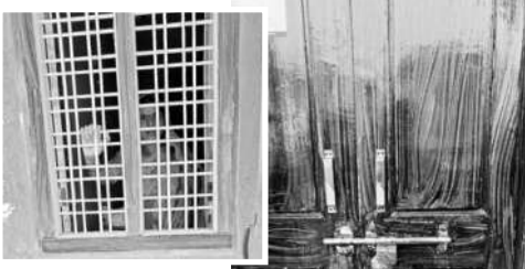
ఇంట్లో ఉన్న రాజు భార్య బాగ్యలక్ష్మి

రఘునాథపెట్టి, నవంబర్ 24 : భూ సమస్యలతో ఓ మహిళను దాయాదులను ఇంటి బంధించిన ఘటన జనగామ జిల్లా రఘునాథపెట్టి మండలం కోమల్లూరు అడివారం జరిగింది. బాధితురాలి కథనం ప్రకారం.. కోమల్లూరు అడివారం జరిగింది. బాధితురాలి కథనం ప్రకారం.. కోమల్లూరు అడివారం జరిగింది. బాధితురాలి కథనం ప్రకారం.. కోమల్లూరు అడివారం జరిగింది.