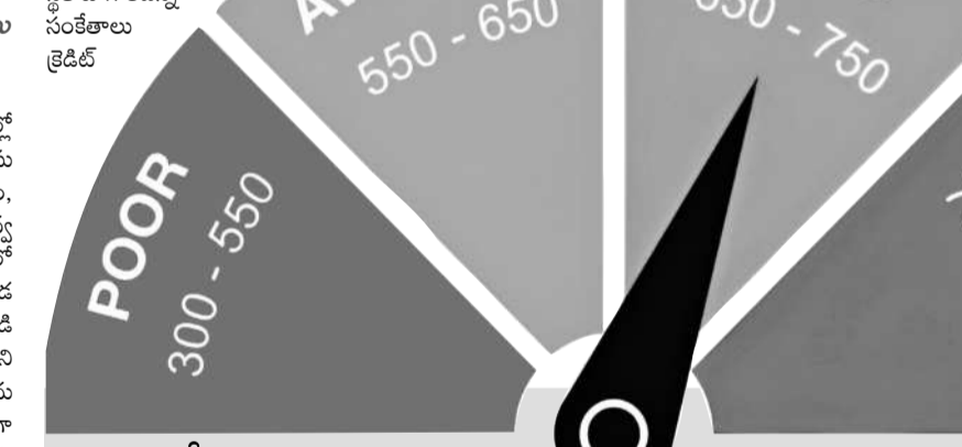
గ్యారంటీలకు దూరంగా.. సెక్యూర్డ్ క్రెడిట్ కార్డులు

క్రెడిట్ సాకీర్ ను క్రమం తప్పకుండా పరిశీలిస్తూ ఉండాలి. అప్పుడప్పుడు మనం తీసుకున్న రుణాలను సకాలంలో తిరిగి చెల్లింపిన పుటికి ఆ సమాచారం క్రెడిట్ బ్యాంకుకు ఉండదు. దానివల్ల మన క్రెడిట్ సాకీర్ పెరగకుండా ఉంటుంది. అలాంటప్పుడు రుణదాత (బ్యాంకులు, ఎన్ బీఎఫ్ సీ)లను సంప్రదించి ఫలితం ఉంటుంది. ఇక ఇప్పుడు ఆన్ లైన్ లో చాలా ఎజెన్సీలు ఉండగానే మనకు క్రెడిట్ సాకీర్ ను తెలియజేస్తున్నాయి. క్రెడిట్ తరచూ మన సాకీర్ ను చెక్ చేసుకోవడం ఉత్తమం.