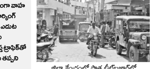
జిల్లా కేంద్రంలో పాత బీటీబిజార్లో రోడ్డుపైనే వాహనాల పార్కింగ్

బ్యాంక్ కాకుండా నిర్వాహణ జరుపుకోవడం కూడా ట్రాఫిక్ లో అవకాశం ఏర్పడుతుంది. ట్రాఫిక్ పోలీస్ స్టేషన్ ఏర్పాటు అవసరం. జనగామలో సుమారు 30వేల ద్విచక్ర వాహనాలు, 2వేల ఆటోలు, ట్రాబీలు, క్రూజర్లు, కార్లు, మరో 2వేల వరకు లారీలు, బస్సులు, డీజీఎంలు ఇతర భారీ వాహనాలు నిత్యం తిరుగు తున్నాయి. ఇవేకాకుండా ప్లావే, ప్రధాన రహదారులపై భారీ, మోస్టరు వాహనాల రాకపోకలు సైతం విపరీతంగా ఉంటాయి. చుట్టుపక్కల గ్రామీణ ప్రాంతాల నుంచి రోజుకు కనీసం 5వేల మందికి పైగా ప్రజలు జనగామకు రాకపోకలు సాగిస్తారు. ట్రాఫిక్ కష్టాల తప్పిం లంటే సూర్యాపేట-సిద్దిపేట, హనుమకొండ-హైదరాబాద్ ప్రధాన రోడ్లను మరొక వెళ్ళు చేయాలి అవసరం ఉంది. వరంగల్ పోలీస్ ఈస్ట్రెజిక్స్ కేంద్రపాలనలో పరిధిలో ఉన్న జనగామ జిల్లా కేంద్రంలో పూర్తి స్థాయి సిబ్బందితో ట్రాఫిక్ పోలీస్ స్టేషన్ ఏర్పాటు చేస్తే ట్రాఫిక్ నియంత్రించవచ్చనే అభిప్రాయాలు వ్యక్తమవుతున్నాయి.