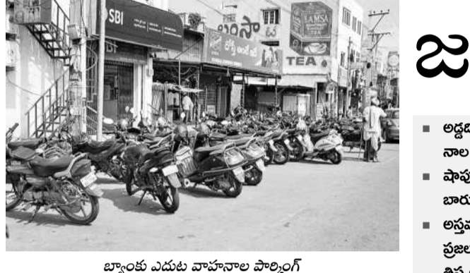
బ్యాంకు ఎదుట వాహనాల పార్కింగ్

జనగామ పట్టణం జిల్లా కేంద్రంగా మారడంతో వాహనాల రద్దీ విపరీతంగా పెరిగింది. సిద్దిపేట- సూర్యాపేట, వరంగల్-హైదరాబాద్ జాతీయ రహదారిపై రాత్రిలబంబళ్ల వరదాది వాహనాల రాకపోకలతో నిత్యం ఛోరస్థా రద్దీగా ఉంటుంది. ఛోరస్థాలో సిగ్నలింగ్ వ్యవస్థ ఉన్నా కంట్రీ లైన్లు వాహనాల రాకపోకలకు అడ్డంకుగా సాగుతుంటాయి. ట్రాఫిక్ పోలీసులు క్రమబద్ధీకరించాలి ఉన్నా ఆ వైపు దృష్టి పెట్టడంలేదు. పైగా దుకాణాల యజమానులు, నిర్వాహకులు తమ ఫాపుల ముందున్న పుట్టిపాతాలను బిల్డర్ వ్యాపారులకు అడ్డం ఇవ్వడం ట్రాఫిక్ కష్టాలకు కారణమవుతుంది. బ్యాంకులు, ప్లెస్, బార్డు, హోటళ్లు, వస్త్ర, వాణిజ్య దుకాణాలకు పార్కింగ్ స్థలం లేకపోవడంతో ఆ ఫాపుల ఎదుట వాహనాలు బారులు తీరి కనిపిస్తున్నాయి. రోడ్డుపై అడ్డాలకు కారణం వహిస్తాయి. వ్యాపారులు తమ దుకాణం ముందున్న స్థలాన్ని పాడుకునే కారణంగా, పండ్లు, ఫూలు అమ్మే చిరు వ్యాపారుల వద్ద ప్రజా లేదా నెలకు ఇంత అనిడబ్బులు తీసుకుంటున్నారు. ఇవన్నీ వారికి తమ