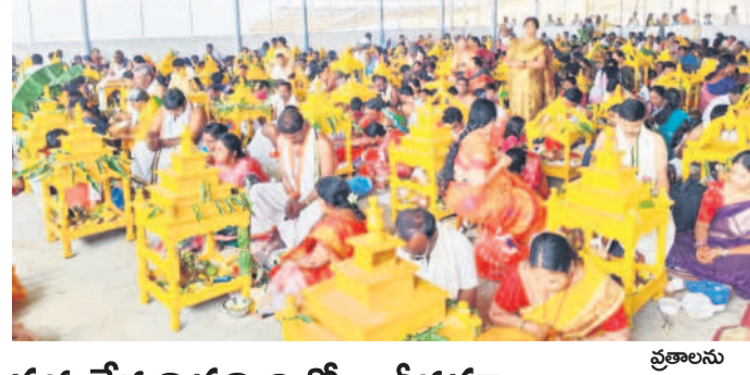
సత్కర్మను సన్నద్ధులలో కార్తీక పూజలు

పల్లెలను వీడని భయం.. కొద్ది రోజులుగా అటవీ గ్రామాల్లో పులి సంఘం రిస్కుండా, గిరిజనం భయంతో వణికిపోతున్నది. ఎప్పుడూ ఏ వెళ్తు నుంచి వచ్చి తప్పి దాడి చేస్తుందోనని భయాందోళనకు గురవుతున్నారు. పులి మహారాష్ట్రకు వెళ్లిపోయిందని అధికారులు ప్రకటించిన మరుసటి రోజే కోర్ డోబ్బా గ్రామ గ్రామ సమీపంలో నాలుగు పశువులపై దాడి చేయడం కలకలం రేపుతున్నది. పులి దాడి జరిగిన కోర్ డోబ్బా గ్రామానికి సమీపంలో బండకన, దాబా, సవాతి, అంతపూర్, గోండ గ్రామాలూ ఉన్నాయి. పులి దాడి ఘటనతో ఆయా ప్రాంతాల ప్రజలు వణికిపోతున్నారు. పులిని డ్రాక్ చేయడంలో అటవీ అధికారులు నిర్లక్ష్యం చేస్తున్నారని ప్రజలు ఆరోపిస్తున్నారు.