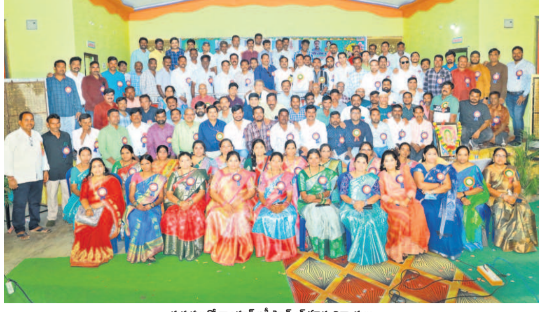
గురువులతో శాంధూర్ జడ్పీసీఎస్ఎస్ పూర్వ విద్యార్థులు

శాంధూర్, నవంబర్ 24 : మండల కేంద్రంలోని సురభి గోదాక్షేత్ర గార్డెన్స్ లో ఆదివారం శాంధూర్ జడ్పీసీఎస్ఎస్ 1997-98 పదో తర గతి బ్యాచ్ విద్యార్థుల అపూర్వ సమ్మేళనం నిర్వహించారు. ఈ సంద