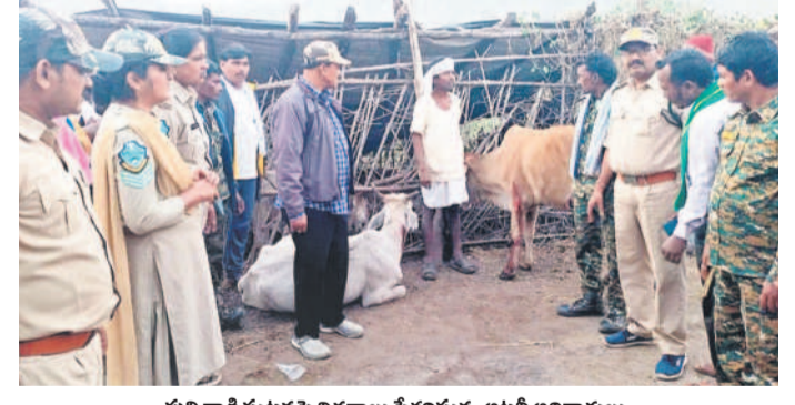
పులి దాడి ఘటనపై వివరాలు సేకరిస్తున్న అటవీ అధికారులు

ప్రజలు అప్రమత్తంగా ఉండాలి హెచ్చరించారు. గౌరి, కొలాంగూడ గ్రామాల్లో అధికారం అవగాహన కల్పించారు. రైతులు ఒంటిగా పొలాలకు వెళ్లవద్దని సూచించారు. పులి కనిసిస్టి వెంటనే సమాచారం అందించాలన్నారు.