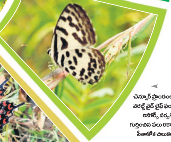
చెన్నూర్ ప్రాంతంలో వరల్డ్ వైడ్ లైఫ్ ఫండ్ లినోర్న్స్ పర్వస్ గుర్తించిన పలు రకాల నీతాకోక చిలుకలు