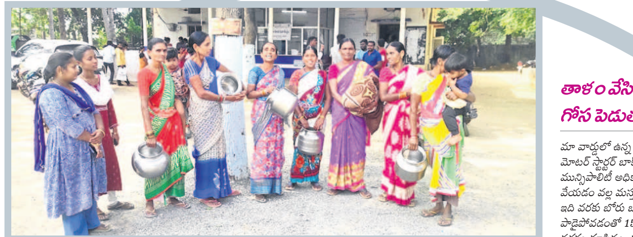
మున్సిపల్ కార్యాలయం ఎదుట ఖాళీ బండలతో నిరసన తెలుపుతున్న మహిళలు