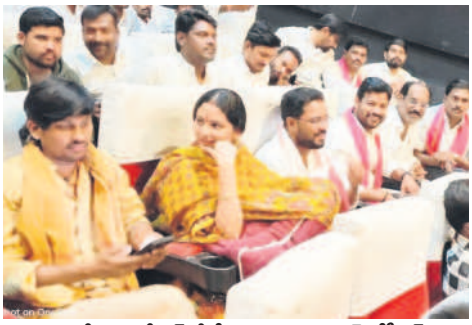
రామవేంకట్రాయ్ తో కేవల వంద రోజులకే (కేసీఆర్) సినిమాను చూస్తున్న చిత్రపండిత సభ్యులు, జి.ఆర్.ఎస్ నాయకులు