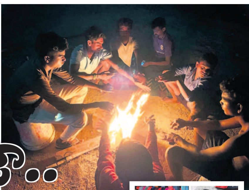
వాణిపతి మండలంలోని ప్రగల్భవల్లిలో రూపాలిని కమ్మకున్న మంచుమట్టి