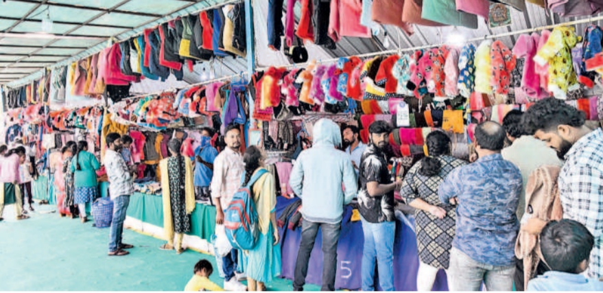
హనుమకొండ పాత మున్సిపల్ మైదానంలో స్వేచ్ఛను కొనుగోలు చేస్తున్న ప్రజలు

శక్తి తగ్గుతుంది. వీటన్నింటినీ తట్టుకోవడానికి అవసరం జాగ్రత్తలు తీసుకోవాలి. వ్యాధుల బారిన పడకుండా ఉంటామని డాక్టర్లు చెబుతున్నారు. వ్యవసాయానికి ప్రతికూలం ఒక్కసారిగా పెరిగిన చలితో వ్యవసాయ రంగంపై తీవ్ర ప్రభావం చూపనున్నది. ప్రస్తుతం చాలాచోట్ల వరి కొరతలు పూర్తయ్యాయి. నార్డు పోసుకుంటున్నారు. అయితే ఈ చలి వల్ల మొలకెత్తే పరిస్థితి లేదు. మొలక శాతం తక్కువగా వస్తుందని రైతులు చెబుతున్నారు. ఇతర పంటలు కూడా ముఖ్యంగా రావం అంటున్నారు. పశువులు వ్యాధుల బారిన పడే అవకాశం ఉంటుంది. వైద్యులు చెబుతున్నారు.