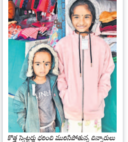
కొత్త స్వేచ్ఛ వస్తూ వరించి మునిసిపాల్స్ వినూత్నాలు