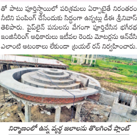
నిర్మాణంలో ఉన్న వృద్ధ జిల్లాలను తోలగించే ప్లాంట్