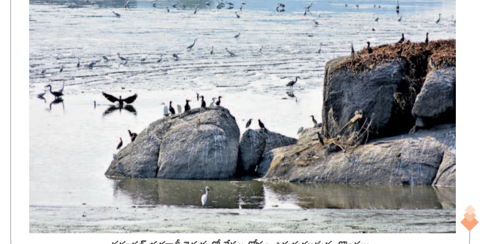
వరంగల్ భద్రకాళి చెరువులో చేపల కోసం ఎదురుచూస్తున్న కొంగలు