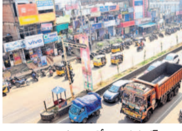
పట్టణంలోని జయశంకర్ సెంటర్

క్లబ్ సభ్యుల సహకారంతో పేదలకు సేవలు అందిస్తున్నాం. 48ఏళ్ల నుంచి పేద మహిళలు, వృద్ధులు, ప్రభుత్వ పాఠశాల విద్యార్థుల కోసం సహాయం, సేవా కార్యక్రమాలు చేస్తున్నాం. ఈ సంవత్సరం నుంచి పేద మేడిసిటీ, ఇంజనీరింగ్ విద్యార్థుల కోసం ఏటా రూ.10వేలు అందిస్తున్నాం. తొలుత 15మందికి ఇచ్చాం.