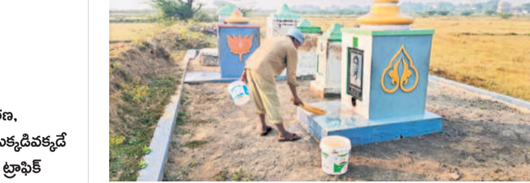
ములుగులో మాజీ సర్పంచ్ భర్త సోదరుడి సమాధిని పుణ్యం చేస్తున్న జీవీ కార్మికుడు